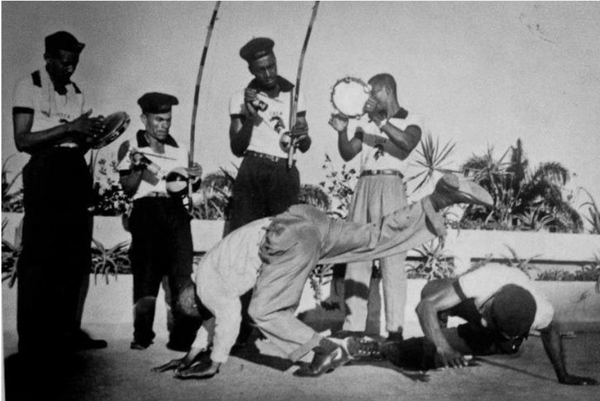
Antigua Roda de Rua

El título de Mestre lo otorga la comunidad de la capoeira, no por su destreza física o conocimientos musicales sino también por su sabiduría y merecimiento de respeto por parte de sus semejantes. Dentro de la Capoeira Angola es fundamental el respeto a la ancestralidad, a los y las que vinieron antes. Aquellos que “abrieron caminos” posibilitando nuestro caminar. Una herencia, como muchas otras que se vivencian que demuestra su africanidad.