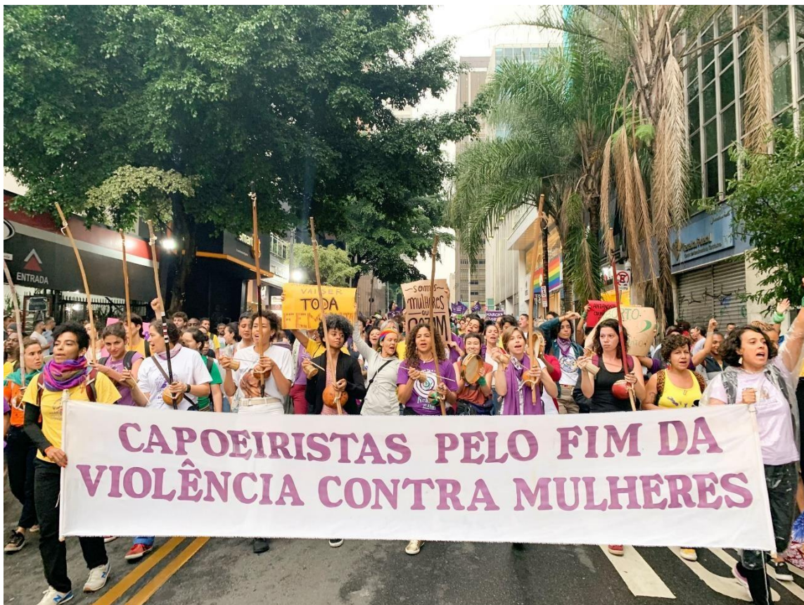
Marcha del 8 de marzo, 2019, Sao Paulo. Cierre evento 25 años del Grupo Nzinga

Este “otro” se nos presenta como desligado del saber, de las prácticas civilizadas e incluso como una amenaza a las mismas. Ese otro es peligroso. Se construye aquí un vicioso círculo de la violencia racista, donde negres e indies son discriminados por sus prácticas, usos y costumbres y a su vez son culpados por la discriminación que sufren por encontrarse fuera del universo moral planteado como “la moral humana” (Branquamento e Branquitude no Brasil.2002. 7) ,es decir la moral blanca eurocentrada cissexista y heteropatriarcal .