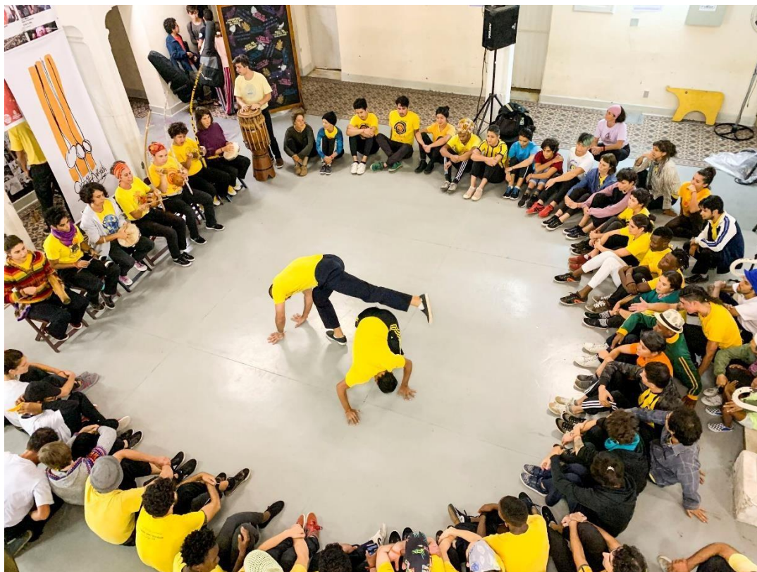
Imag.2 Roda de Capoeira Angola. Evento 25 Años Grupo Nzinga, Sao Paulo, Marzo 2019

ritual; así como ejercitar la escucha y la humildad, el respeto y valoración a les mas antigües. Es a partir de esta vivencia, en primera persona, que comenzamos a preguntarnos por “otros lugares”. Es a partir del toque del birimbao, de poner las manos en el piso y mirar el mundo “dado vuelta”, que comenzamos a preguntarnos ¿Porque esto es “lo otro”? ¿Por qué se dice que “eso” es civilización? ¿Porque se dice que “esto” no lo es?, así como también preguntarnos ¿Quién lo dice? ( Memórias da plantação , 2019. 50).