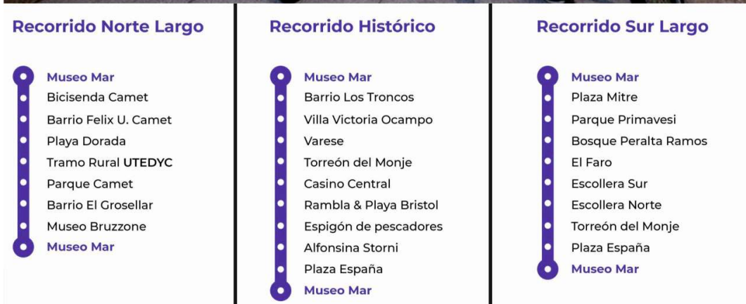
Imagen 3: Registro del circuito Bicitarte y trayectorias disponibles para realizar.