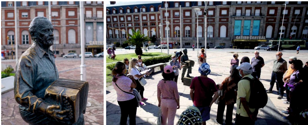
Imagen 2: Registro de las caminatas del circuito turístico Astor Piazzolla durante la pandemia.

De esta forma, no sólo se pudo incentivar y reactivar el movimiento de personas – con la salvedad de mantener los protocolos estipulados por el Ministerio de Salud de la Nación- sino que también, se intensificó la coordinación de distintos eventos que