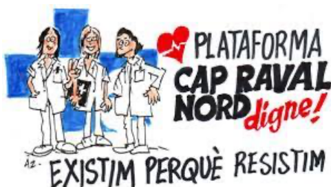
Figura 7. Logo de la Plataforma.