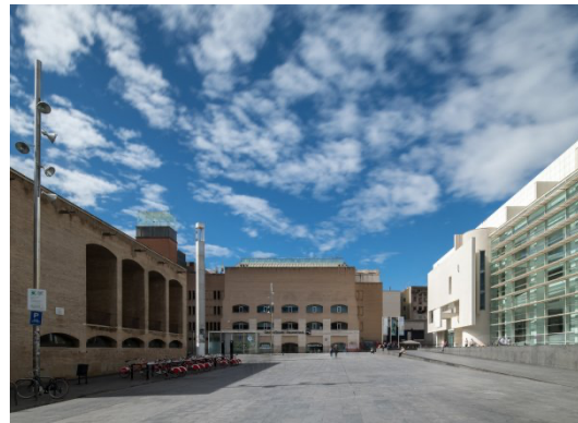
Figura 5. Plaça dels Àngels. Año 2018.

Por otro lado, la reordenación de espacios y el crecimiento del museo ha sido una constante desde su inauguración. En el año 2013 el Ayuntamiento de Barcelona, durante el mandato de Xavier Trias 5 , firma un convenio de cesión gratuita de la Capilla de la Misericordia al MACBA por un período de 30 años. La cesión de este espacio respondió a la necesidad de tener un mayor espacio expositivo; el proyecto se recoge en octubre de 2017 con la aprobación del documento "Estratègia MACBA 2022: Reptes i objectius".