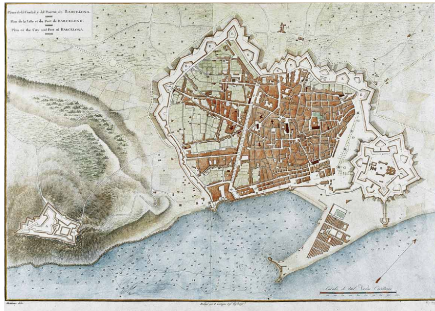
Figura 1. Mapa de Barcelona 1806.

Fernández (2014), el Raval paso de ser la ciudad-convento a la ciudad-fábrica con un notable aumento de la población.