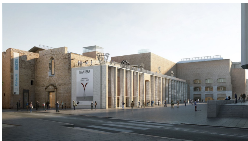
Figura 9. Proyecto de ampliación del MACBA