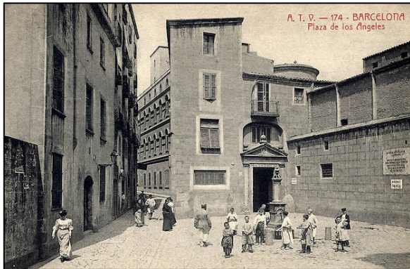
Figura 4. Plaça dels Àngels. Año 1900.

ni el uso al que se dedicaría la nueva edificación, por tanto, que finalmente se construyera en el Raval y albergara el museo es fruto de la visita del arquitecto a la ciudad y de la coalición de intereses de aquel contexto. La transformación que supuso el edificio en el área colindante fue extraordinaria y destaca el contraste de este frente a la trama urbana densa del barrio. Asimismo, para la construcción de estos equipamientos fue necesario derruir varias manzanas de viviendas y desplazar la situación inicial de la plaça dels Àngels.