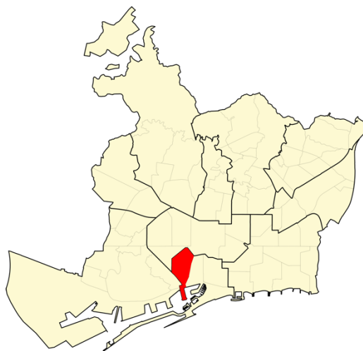
Figura 2. Localización del barrio de el Raval en Barcelona.

A partir de ese momento, el movimiento obrero irá consolidándose, convocándose numerosas huelgas para reclamar mejoras laborales. La alta densidad de población y la construcción de viviendas de baja calidad se reflejará en la obra de Ildefons Cerdà “Monografía estadística de la clase obrera” (1856), en la cual se analizan las condiciones de vida de la población de los barrios intramuros, y se afirma que la densidad de población y los factores sociales son determinantes para el desarrollo de enfermedades. La urbanización del Eixample provocó que aumentará la desigualdad entre barrios, al concentrarse en el Distrito V (Raval) las clases populares con menor poder adquisitivo, y con la migración de población del resto del Estado.