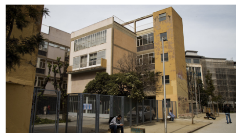
Figura 8. CAP Raval Nord.