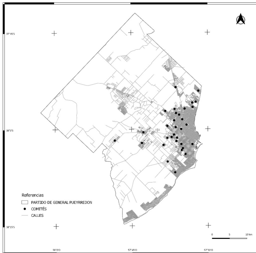
Figura 2. Distribución de los CBE en los barrios de Mar del Plata, Partido de General Pueyrredón

https://www3.mdp.edu.ar/attachments/category/27/CEU_BATAN_INFORME_SOCIO_COMUNITARIO_REDBATAN.pdf