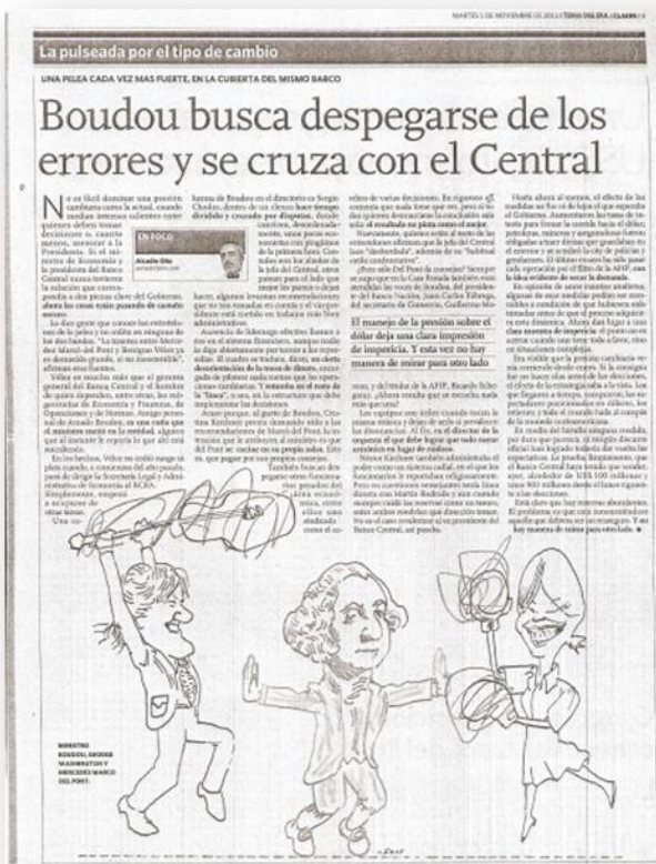
Imagen 06 Diario: Clarín – Fecha: 01-11-11. Título: Boudou busca desprejarse de los errores y se cruza con el Central

En lo referente a las caricaturas, éstas funcionan reforzando la argumentación. En la imagen 06 de la nota “Boudou busca desprejarse de los errores y se cruza con el Central” vemos que se encuentran caricaturizados el, en ese entonces, Ministro de Economía Amado Boudou armado con su guitarra y dispuesto a golpear a la presidenta del Banco Central Mercedes Marco Del Pont quien tiene que puesto unos