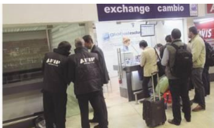
Imagen 03 Diario: El Cronista Comercial – Fecha: 31-10-11 Título: Ofensiva para controlar 2% del mercado cambiario revive temores por el dólar

En Clarín también advertimos dos tipos de imágenes predominantes: por un lado, las fotográficas que describen una atmósfera de control como la sugerida en la imagen 03 donde se ve un primer plano de la placa de un inspector de la Dirección General Impositiva y, por otro lado, en la imagen 05 donde se ve a un policía de brazos cruzados en la puerta de una casa de cambio. Este tratamiento de las imágenes podría provocar el efecto de sentido que el medio estuvo donde transcurre la noticia. Asimismo en Clarín , a diferencia de El Cronista Comercial , se hace uso de las caricaturas. Sin embargo, vemos que cuantitativamente se utiliza más el primer tipo imágenes y que sobre éstas predomina la composición fotográfica que representa un “control”.