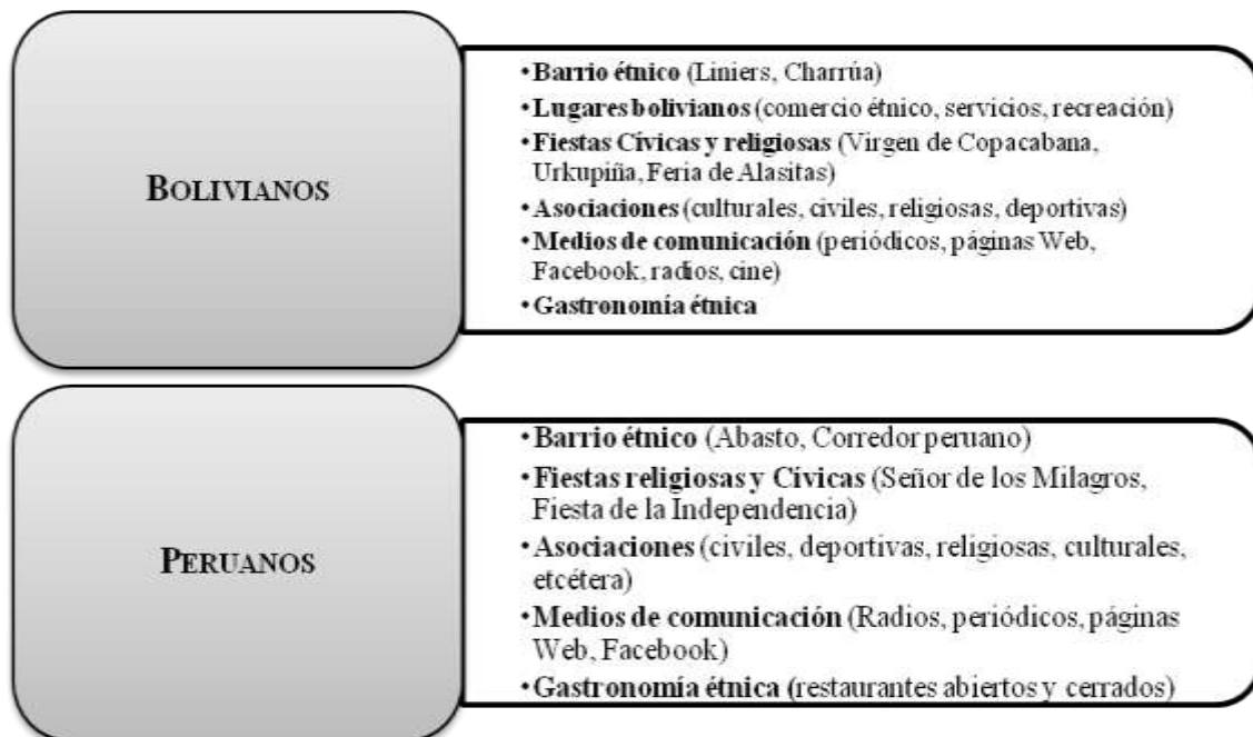
Cuadro 0.2 Estrategias de inserción cultural de la colectividad boliviana y peruana en la Argentina.

Las migraciones bolivianas y peruanas han sido persistentes en distintos grados y están más asentadas en nuestro país. Esta situación les ha permitido desarrollar estrategias de inserción cultural (Altamirano, 1983) como la fundación de asociaciones, la práctica de festividades religiosas y cívicas, el desarrollo de actividades comerciales y de medios de comunicación, así como la conformación de lugares y barrios étnicos (Sassone, 2006) (Cuadro 0.2).