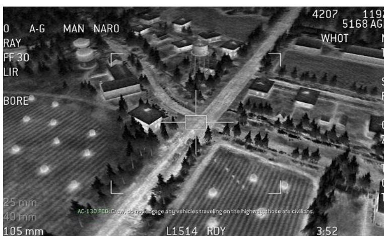
Imagen 1: Vista de Drone en video juego Call of Duty Strike from Above 2

El juego ha sido definido por Lev Vigotsky como la actividad rectora en el desarrollo de los niños; la raíz de esta afirmación anida en que se trata de una actividad que constituye la