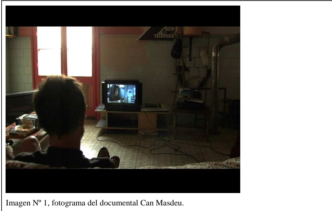
Imagen N° 1, fotograma del documental Can Masdeu.

Por último, incluir la video-elicitación como recurso narrativo me permitió representar la síntesis que abarca el pasado y el presente, sin tener que recurrir a los indicios gráficos (los didascálicos) 5 , o a la inclusión de texto escrito. El ejemplo de las imágenes N° 1 y 2 corresponden a un fotograma extraído de una escena del capítulo 6 “Aire” del documental “Can Masdeu”. En esta escena, se alcanza la síntesis entre el presente y el pasado, a través de las reflexiones de los interlocutores al observar el material editado tres años atrás (video-elicitación). De esta forma, la puesta en escena se acerca a la definición expresada por J. Ruby “La antropología se define actualmente [...] como una ciencia que puede acoger la inherente relación reflexiva entre el productor, el proceso y el producto. Y J. Grau añade “... y a éstos con la audiencia” (Grau, 2001: 58).