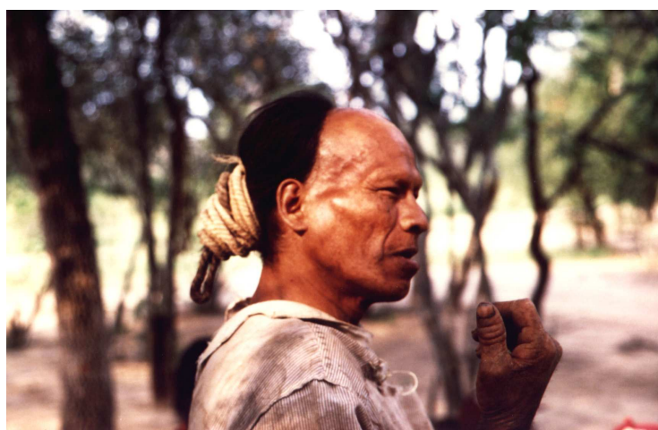
Chaco. Parojnai Picanerai. Hombre Ayoreo Totobiegosode contactado con su familia nuclear en octubre de 1998.

“¿Cómo podemos esperar siquiera que una empresa nacional o extranjera se aventure a invertir en el territorio chaqueño, con el riesgo de que un día cualquiera aparezca por el vecindario un silvícola y le den orden de parálisis absoluta? Dicen que ellos tienen derechos prioritarios por ser los primeros habitantes de estas tierras. Pues para bien o para mal, hay de por medio cinco siglos que han hecho de este un país de cinco millones de habitantes. Si vamos a hacer justicia, en base a aquel criterio, los cuatro millones y pico que no somos indígenas en estado puro tendríamos que caer al mar o entra en órbita. (...) Tenemos que asumir que los silvícolas son personas y no animalitos a los que podemos condenar -porque a nosotros nos parece que esa es su opción- a vivir en una especie de zoológico. Y tampoco son ciudadanos de una casta superior cuyos derechos están por encima de cualquier otro paraguayo, así sea indígena, mestizo o descendiente de ucraniano.” 17