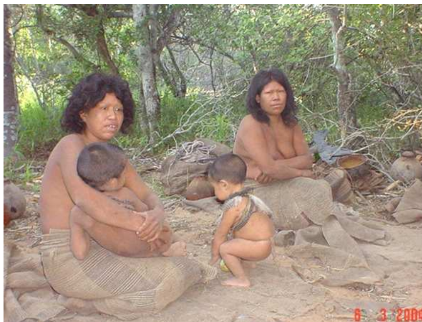
Chaco. Alto Paraguay. Mujeres Ayoreo Totobiegosode del subgrupo Areguedeurasade, en Chadi, en los primeros días del contacto.

En la mañana del 3 de marzo de 2004, en oportunidad de una inspección de la zona para la identificación de lugares en los que se procedería a la construcción del tajamar previsto para el nuevo asentamiento, dos hombres totobiegosode, acompañados de dos tractoristas y un miembro de la Ong GAT vieron en una picada a tres hombres silvícolas. Los Totobiegosode intercambiaron desde lejos palabras en su idioma y posteriormente se produjo el acercamiento. Informaron luego que se trataba de una familia extensa de 17 personas, hombre, mujeres y niños, y que irían a buscar a las demás personas que quedaron en resguardo en un sitio cercano. A la mañana siguiente el grupo completo se encontraba en Chaidi.