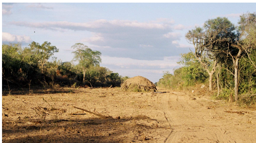
Chaco. Alto Paraguay. Vivienda de los Areguedeurasade, abandonada antes del reencuentro en marzo de 2004. Sur del Patrimonio Indígena, sobre una picada recién abierta.

El caso aún no ha concluido. La experiencia básica de re-territorialización que pretenden los Ayoreo Totobiegosode está facilitada por la letra de la norma. “Éramos un pequeño grupo a punto de desaparecer. Hoy estamos con vida, y estamos creciendo. Esto es por la lucha de nuestros mayores” 27 , ha manifestado recientemente un joven maestro Totobiegosode. Más el cumplimiento de la norma sigue encontrando dificultades. Aún así, los esfuerzos permanecen, y los logros en curso certifican las ventajas que estos reportan no sólo al amenazado grupo Ayoreo Totobiegosode sino a la sustentabilidad misma de la región y de la sociedad en su conjunto.