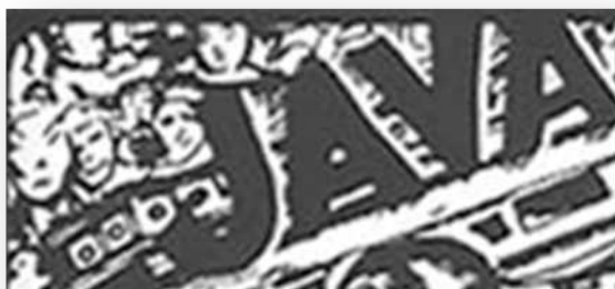
Detalles Fig. 4

En cuanto al dibujo-relato sobre las peripecias de la orquesta tramado en la mitad inferior de la serie de ilustraciones, éste da a ver otra narrativa paralela y simultánea que, por una parte, refuerza el pacto instaurado desde la portada: el lector/espectador ha entrado al cine al abrir el libro. Por otra parte, incita a desviar de vez en cuando la mirada, a seguir los avatares de la comedia que allí se desarrolla. Esta estructura compleja nos habla de un lector/espectador familiarizado con las diversas manifestaciones de la cultura visual, capaz de circular entre varios códigos y convenciones con fluidez.