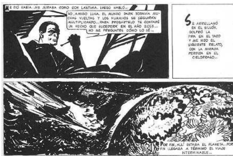
Figura N° 3

Con ésta y con el Mort Cinder (Figura N° 4), Breccia se gana el lugar que lo colocará en la cima de la historieta mundial. Sin embargo, la ilustración está puesta aún al servicio del relato. Los dibujos están ahí para contar una historia, para representar algo previamente establecido en un guión, en una historia.