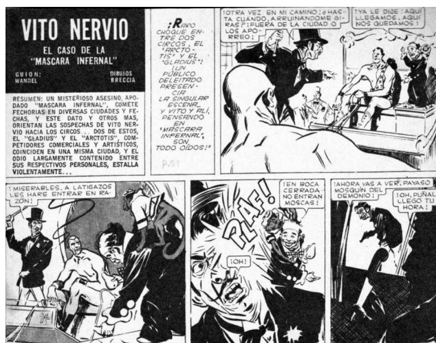
Figura Nº 1

Ese pasaje se da en la obra de Fontanarrosa de forma más que evidente en el periplo que va de Ultra – uno de sus mejores trabajos y el más experimental, sin duda alguna- al último Inodoro Pereyra y los chistes. En Breccia, en cambio, el pasaje se da de forma inversa. Del dibujante esquemático y algo estructurado de Vito Nervio al autor de Dracula , dracul , Vlad , Blah! opera una transformación que impide incluso reconocer en ambas obras al mismo artista (ver Figura Nº 1 y Figura Nº 2). La pregunta que cabe hacerse a continuación es ¿se trata del mismo?