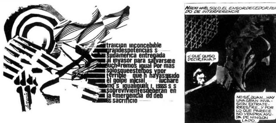
Figura N° 5

En esta escena en particular, la tipografía (que es el lugar donde lo “literario” y lo “gráfico” se encuentran mutuamente) es confusa. Lo que sale de la radio no es algo que pueda entenderse tan fácilmente. La pregunta de Juan “¿Qué quiso decir?” condensa el conflicto que intentamos señalar, en esta historieta en particular, entre sus dimensiones simbólica e icónica. Frente al montón de letras difusas que se entremezclan hay una necesidad por parte del “mensaje literario” de dejar las cosas en claro. Esto es lo que se quiere decir. Esto y no otra cosa. Oesterheld aclara lo que Breccia oscurece (Figura N° 5).