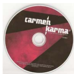
Carmen Karma “Demo” (2008)

- En el extremo más inconcreto de la representación encontramos discos con una tendencia gráfica completamente abstracta , como los dos demo de Carmen Karma (uno presenta esta temática en sobre el CD mismo, mientras su packaging es sólo un sobre blanco; el otro, sobre la portada, mientras el CD es un comprado virgen y grabado de forma casera). Consisten en unas tiras rojo y negras en perspectiva hacia el fondo superior a la derecha en el caso del CD, y gris y blancas, perdiendo perspectiva y centradas hacia el extremo inferior izquierdo en la fotocopia que auspicia de tapa. Mantienen la tipografía del nombre de la banda y la información que indica: “demo” en ambos ejemplares. En el caso del CD impreso se agregan también el mail de la banda, y la adjudicación de los derechos de autor.