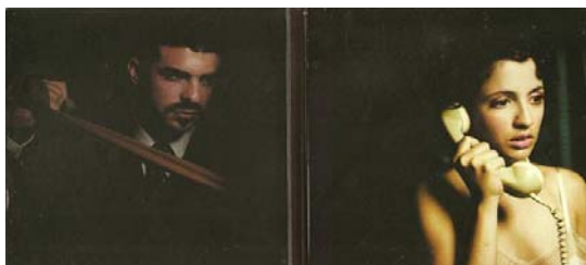
Caras internas de: Utopians “Inhuman” (2008)

- Uno de los CDs construye narración entre las distintas partes del disco y en cada imagen de ellas por separado. Es el ejemplo de “Inhuman” de Utopians, donde se evoca a una suerte de historia policial o de misterio entre las distintas caras del disco. Manteniendo una línea artística que respeta el escenario y vestimenta propia de los años 50, en una imagen se observa a dos de los integrantes de la banda sentados en la mesa de lo que aparenta ser el vagón de un tren, mirándose cómplicemente y con armas en la mano, como si estuvieran tramando un crimen. En otra de las imágenes, entre sombras, se ve al guitarrista, sosteniendo una chalina o pañuelo rojo y estirándola como si se dispusiera a ahorcar a alguien. En la carilla siguiente, se ve a la cantante hablando por teléfono, preocupada, mientras, por la yuxtaposición de imágenes, se concluye que está por ser asesinada por el hombre descrito en el cuadro anterior. La contratapa ofrece la imagen de una mano de mujer vertiendo veneno sobre una copa de servida.