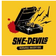
She Devils – “Horario Invertido” (2007)

- Otro de los modos dentro de las tapas con función de representación son aquellas que, mediante su composición visual grafican la temática específica del disco . Dentro de este modo se encuentran tapas como “Gordas Putas” de Las Vin Up, en la que se muestra una panza desbordante de grasa y con el término “dieta”, una carita sonriente y corazones escritos sobre ella con lápiz labial rojo. Es una estética verdaderamente desprolija y desafiante que remite al legado de rebeldía y trasgresión propio del punk . La tipografía cumple la función de anclar el nombre de la banda y del disco y de explicitar la auto-adjudicación de un sitio dentro de la oferta musical y universo social (135% punk rock de chicas).