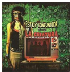
Estoy Konfundida “La Criatura” (2007)

Por último, resulta menester considerar el arte de tapa de “La Criatura” de Estoy Konfundida. En comparación con la mayoría de las tapas analizadas, está repleta de ornamentación y figuración en todas sus formas. El fondo mismo es una suerte de empapelado verde con motivos florales recargados, sobre el que se despliega la imagen en primer plano de un TV viejo, deteriorado (en cuya pantalla se ve la contra-sombra de las integrantes del grupo), y en segundo plano la figura realista-grotesca armada a lo Frankenstein con trozos de cuerpo de cada una de las integrantes, con efecto de pegado y cosido entre los mismos. La imagen en general, de colores saturados, grandes contrastes y juegos de sombras remite al mundo del cine de terror bizarro clase Z, y esto se confirma en el modo del juego tipográfico, que recrea los motivos típicos de las películas de zombies, como por ejemplo, la letra “chorreante” como si estuviera escrita con sangre. En este caso, la letra cumple una función de relevo dentro de la tapa como escenario en el cual la banda se presenta de acuerdo a la temática específica del disco. Es decir, resulta complementaria del texto visual, y es fragmento de la unidad general del disco. En este caso indica: “Estoy Konfundida presenta: La Criatura”, tal como un cartel de cine.