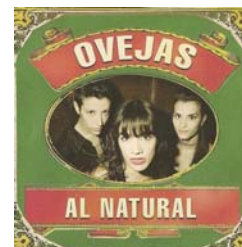
Ovejas – “Al Natural” (2007)

Resulta un caso curioso dentro de esta categoría el demo (sin nombre) de Metamórfica. Consiste en una caja de plástico chata y transparente, dentro de la cual puede verse el CD, pintado en negro y pequeñas líneas es grises, simulando ser un vinilo. En su centro, donde