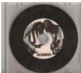
Metamorfica – Demo (2007)