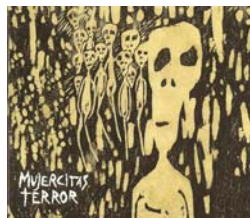
Mujercitas Terror – “Mujercitas Terror” (2007)

Otro caso dentro del mismo conjunto, aunque más moderado, es la tapa de “Horario Invertido” de She Devils, donde es posible observar la imagen de un tocadisco del cual salen despedidos una suerte de rayos que simulan (con función onomatopéyica) un sonido perturbador, agresivo o malo. Detrás de esta figura hay una suerte de mancha roja, como si fuera una gota de sangre, y el juego tipográfico ancla la información del grupo y del disco. La imagen sugiere un tipo de sonido violento, poco convencional, moderno, que rompe con lo establecido, con lo tradicional (representado en la imagen del tocadisco en contraposición a los impetuosos rayos sonoros), y prepara para una escucha regida por tales principios.