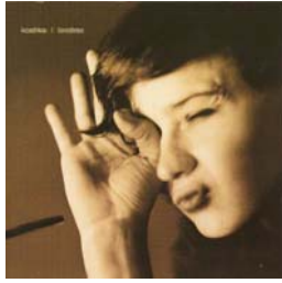
Koshka “Londres” (2007)