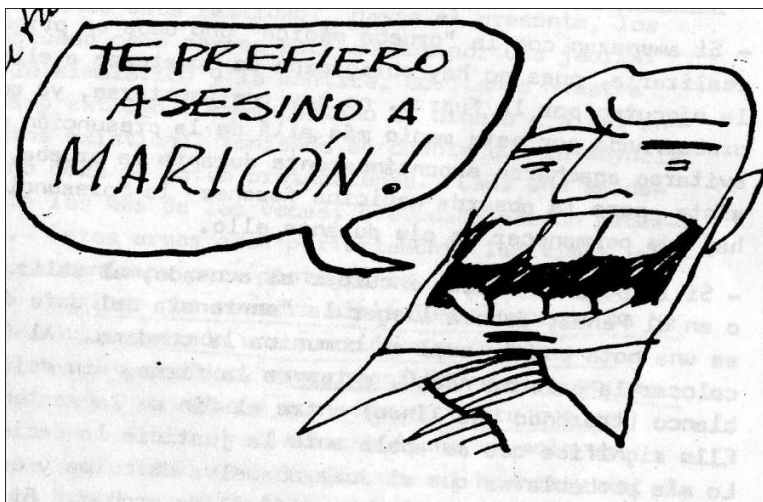
Figura 1 y 2 Revista Somos N° 1, Buenos Aires, diciembre 1973