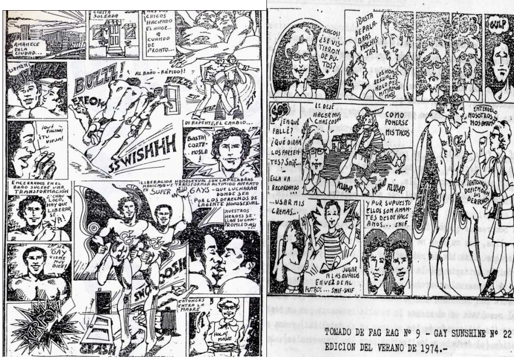
Figura 3 y 4 Revista Somos Nº6, Buenos Aires; agosto 1975