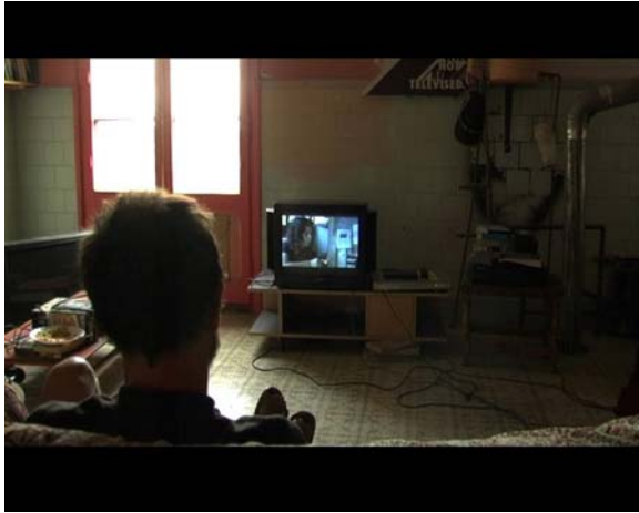
Imagen Nº 1, fotograma del documental Can Masdeu.

“Can Masdeu”. En esta escena, se alcanza la síntesis entre el presente y el pasado, a través de las reflexiones de los interlocutores al observar el material editado tres años atrás (video-elicitación). De esta forma, la puesta en escena se acerca a la definición expresada por J. Ruby “La antropología se define actualmente [...] como una ciencia que puede acoger la inherente relación reflexiva entre el productor, el proceso y el producto. Y J. Grau añade “... y a éstos con la audiencia” (Grau, 2001: 58).