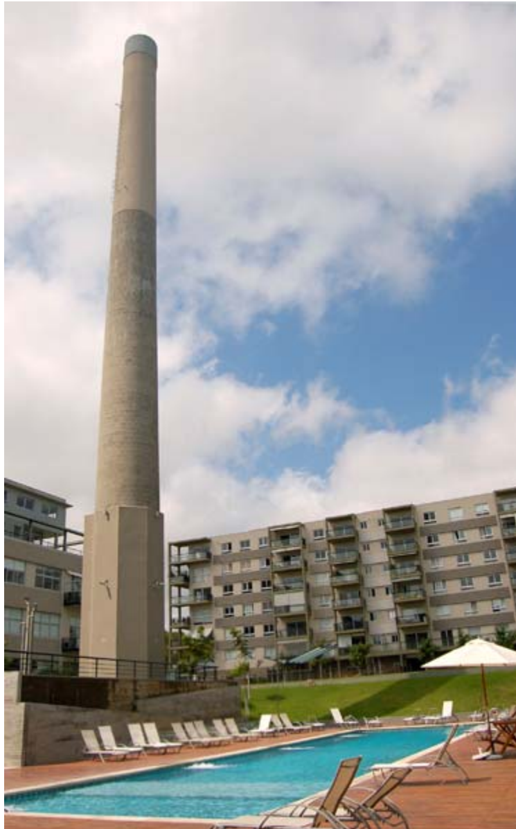
Complejo Aconcagua. Marzo de 2008.