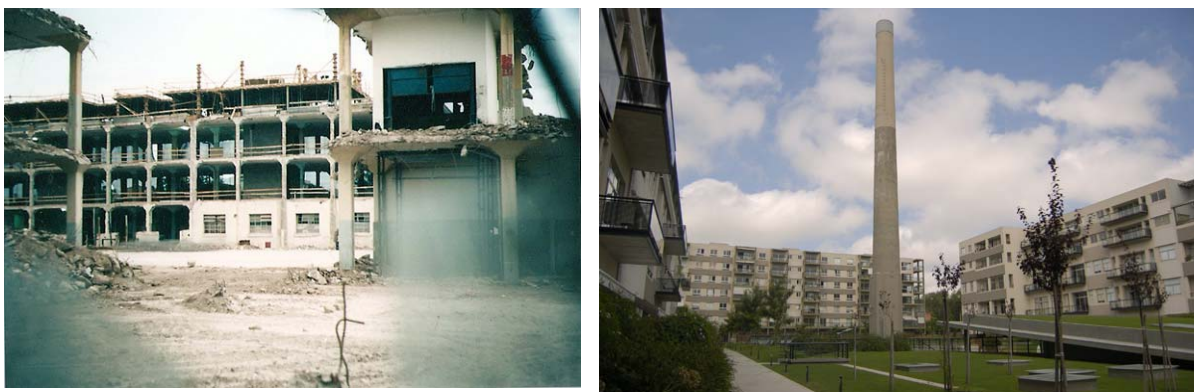
Hacia adentro 2004. Desde adentro 2008

En algunos de los predios elegidos para estos emprendimientos funcionaron fábricas o industrias que cerraron y dieron paso a la reconversión y refuncionalización del lugar 4 . El Complejo Aconcagua ilustra esta situación. El mismo está delimitado por las calles Plaza, Tronador, Manuela Pedraza y Núñez. Allí funcionó desde el año 1931 y hasta principios de los años ochenta la fábrica de chocolates NESTLÉ. Luego el lugar se destinó a depósito de New San a partir del año 1992. En el 2003, los dueños decidieron emprender un proyecto inmobiliario: el Complejo Aconcagua . Ocupa todo el predio y tiene una superficie cubierta de 24.000 m 2 .