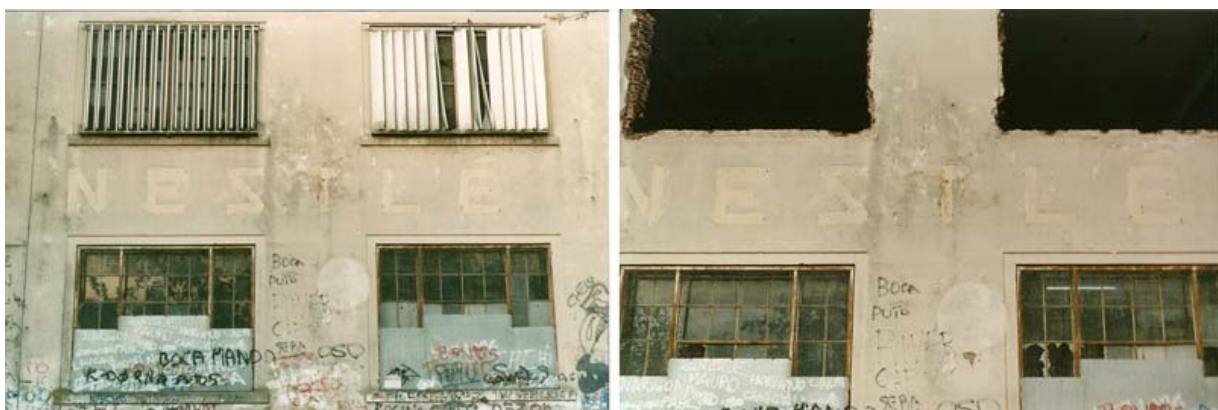
Edificio de la Ex Fábrica Nestlé. 2004 – 2005. Inicia la construcción del Complejo Aconcagua .

Es a partir de 2003 que se produce lo que Svampa denomina la consolidación de la brecha urbana. La reactivación económica influyó también en la inversión inmobiliaria: la construcción creció entre enero y mayo de 2004 un 21% y la mayor tasa de crecimiento se centró en la construcción de viviendas en barrios cerrados y zonas de poder adquisitivo alto. Así, las construcciones en urbanizaciones cerradas experimentaron un crecimiento sostenido. Quienes siguen optando por este estilo residencial privilegian los accesos seguros y los megaemprendimientos, así como también los barrios cerrados y countries más consolidados. De este modo asistimos hoy a la consolidación de la fragmentación social y de la segregación espacial abiertas en la década del '90.