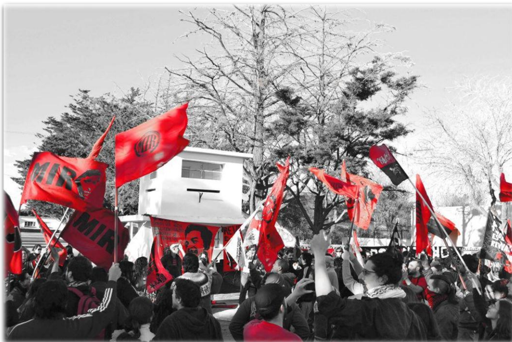
Imagen N° 7: Acto en el Aniversario N° 40 de la Masacre de Trelew Fuera del Penal de Rawson (Unidad n° 6), tomada por Axel Binder.