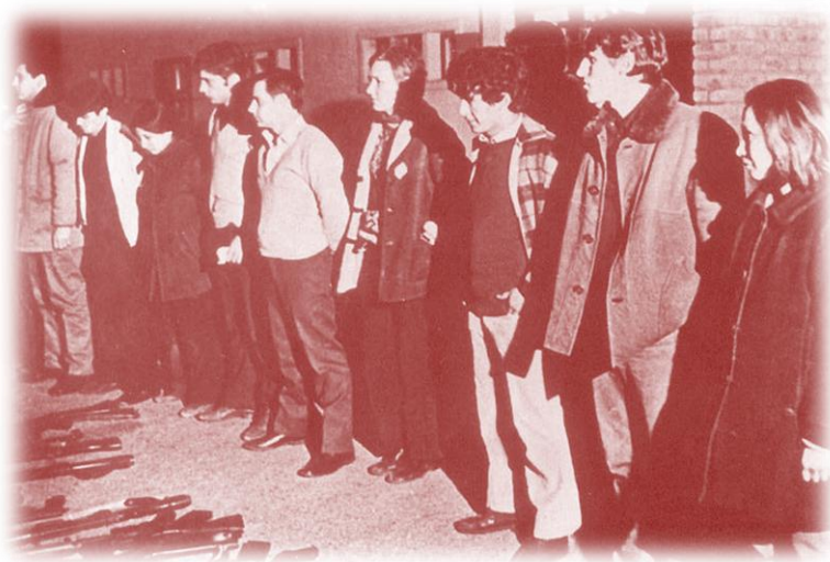
Imagen n° 1: Fotografía tomada en la toma del aeropuerto de Trelew, en la entrega.

Es esa bronca organizada la que se mantuvo viva más de cuarenta años en Trelew la que nos movilizó a generaciones y generaciones a seguir levantando una misma bandera, la de la defensa de los derechos humanos de ayer y de hoy, la que nos inspiró para crear la Cátedra abierta de Derechos Humanos 22 de agosto, y a exigir memoria, verdad y Justicia por los caídos en la Masacre de Trelew.