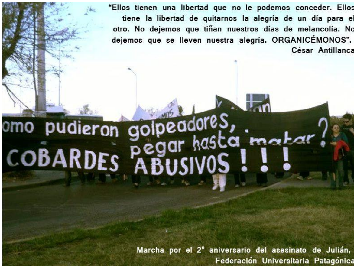
Imagen n° 5: Marcha por el Aniversario del asesinato de Julián Antillanca.