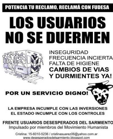
IMAGEN 3: Volante de FUDESA (Frente Usuarios Desesperados del Sarmiento). Las demandas de los usuarios se radicalizaron desde 2011, cuando dos grandes eventos –una “furia” de viajeros en Mayo: un choque con 11 muertos y 265 heridos, en Septiembre- legaron nueva y renovada visibilidad pública y mediática a la problemática.

A principios de Mayo de 2011, una nueva “furia” de usuarios tiene como consecuencia grandes destrozos en la estaciones de Haedo –histórico epicentro de esta tipología de eventos-, Ramos Mejía y Ciudadela. Retroalimenta las demoras y el mal funcionamiento general del sistema 7 , y es acompañada por la radicalización y el crecimiento en la organización de las demandas (ver Imagen 3 ). Tras esta nueva oleada de “furias”, surgen nuevas y/o renovadas versiones sobre las características de su génesis (desde la difundida académicamente, ya mencionada, de los “ trenes en llamas por disconformidad de usuarios ” hasta otras que inducen un daño auto-infligido por parte de TBA para justificar nuevas inversiones gubernamentales). La complejidad del tema amerita, creemos, nuevas y exhaustivas investigaciones.