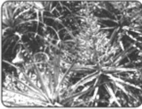
En nuestra Tierra (Alhua) Dios vivía entre nosotros.