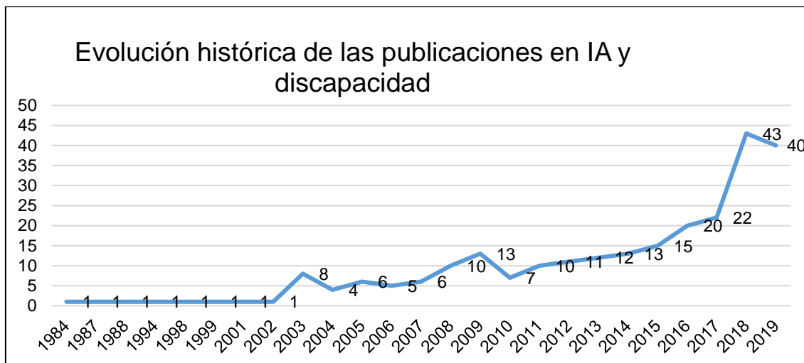
Gráfico 1- Evolución histórica de las publicaciones

A partir de allí, se hallaron 253 trabajos que describen diferentes temas tales como: IA y desarrollo humano; discapacidad mental, IA y aprendizaje innovadora; Psicoterapia e IA; accesibilidad y tecnología médica; lenguaje, teoría de la información e IA; análisis de contenido, redes sociales digitales y discapacidad; tecnología informática asistiva; Ingeniería y diseño accesible; algoritmos, autismo y automatización y desempeño de habilidades; IA y actitud de las personas con discapacidad; Internet de las cosas y cuidado. IA, robots e interacción social; entre otros.