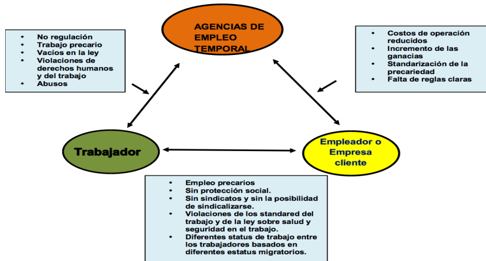
Figura 1. Relación triangular e impactos de la industria del empleo temporal sobre las condiciones de trabajo de inmigrantes

En 2017, los ingresos operativos de este sector se han más que duplicado llegando a 14.500 millones de dólares (Estadísticas Canadá, 2019). En Quebec este sector no ha tenido una regulación específica ni un encuadre legal que defina sus actividades ni responsabilidades frente a los derechos laborales (Bartkiw, 2009, Bernier, 2014b) hasta 2018. Consecuentemente, aún existen muchas violaciones de derechos laborales con inmigrantes con estatus precarios.