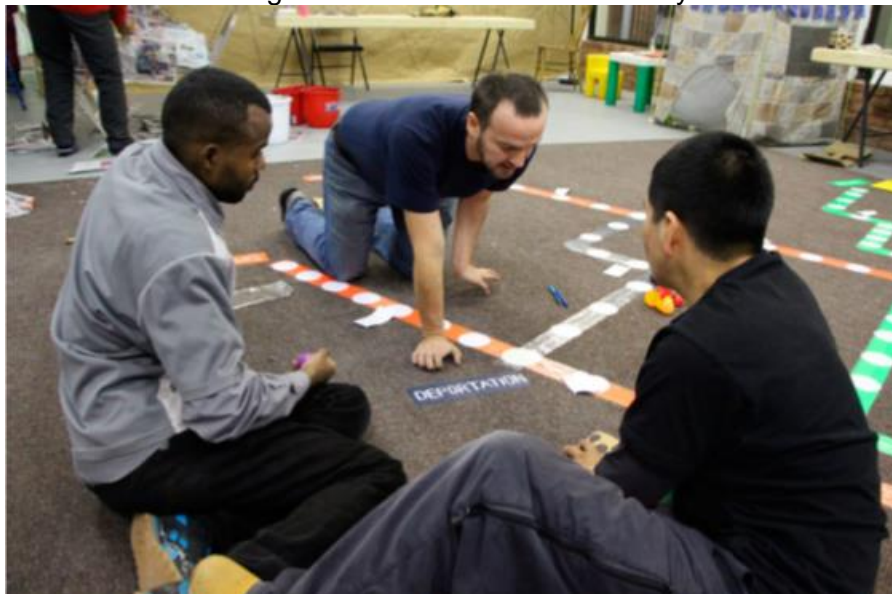
Figura 3. Miembros del “Bloque de Artistas” del CTI y de la ATTAP desarrollan una escena alrededor del mapa del metro de Montreal en la estación rebautizada como DEPORTACIÓN. Escena de la residencia artística popular en Shopping Côte-des-Neiges (Montreal, 2015).

Con el paso del tiempo, el trabajo de la ATTAP, se convirtió en una especie de programa de educación-investigación-mobilización que llegó a incluir el arte. El Bloque de Artistas, un grupo artístico que utiliza educación popular y activismo, apoyó desde 2013 los procesos de organización. Su trabajo dio más visibilidad a las campañas con teatro callejero, teatro de los Oprimidos (Boal, 1985), instalaciones, pintura, poesía y otras expresiones artísticas para ilustrar las condiciones de los trabajadores inmigrantes.