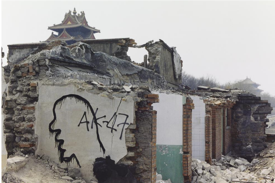
Fig. 3. Zhang Dali, Ciudad Prohibida . Serie Diálogo y demolición, Beijing, 1999. Fotografía.

A través de esta serie, Zhang buscaba establecer una forma visible de comunicación entre lo que permanece y lo que es destruido, al tiempo que postulaba preguntas reflexivas respecto de la legitimidad de la modernización, sobre los costos que implicaba para el patrimonio histórico y cultural de la ciudad, y especialmente, sobre el impacto de la deshumanización que invisibilizaba el sufrimiento físico y psicológico de las personas y de las comunidades afectadas por este proceso. Acerca de estos temas, Zhang Dali expresaba en 1998: