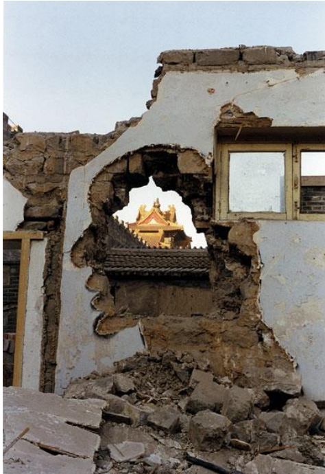
Fig. 2. Zhang Dali, Demolición 125-A . Serie Diálogo y demolición. Fotografía. Beijing, 1998.

Desde un interés particular por el movimiento propio y por la presencia física, corporal, en los espacios que retrataba, Zhang se movía, a pie o en bicicleta, siendo testigo de la demolición y el derrumbe diario de viejos edificios, templos, callejones y barrios antiguos, pero también del desarraigo y reubicación forzosa de sus habitantes, en el marco de una propaganda oficial dirigida a lograr la aceptación entre los ciudadanos de que la “modernización” era tan buena como necesaria (Wu, 2000).