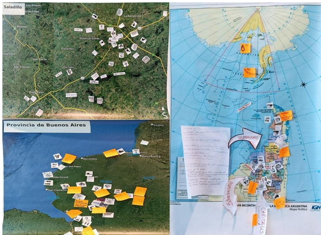
Figura 2. Mapas producidos durante el mapeo participativo.

El taller de mapeo participativo pretendió generar una instancia de reflexión, debate y compartir de saberes acerca de los conflictos ambientales. También vivenciar una manera de iniciar un trabajo en EA a partir de los saberes de quienes participan en los espacios educativos; Se trabajó en pequeños grupos identificando conflictos ambientales en tres escalas: local (zona de Saladillo); local extendida (provincia de Buenos Aires) y nacional (Argentina), con el soporte de iconografías (Risler y Ares, 2019) referidas a problemáticas ambientales, como se muestra en la Figura 2. Se rememoraron situaciones, actividades que se hacían antes y ahora no en lugares que fueron modificados; surgieron preguntas acerca de los conflictos ambientales y sus manifestaciones.