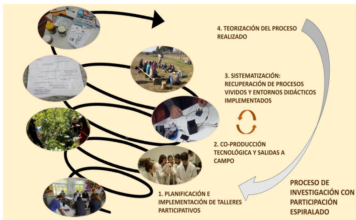
Figura 1. Proceso espiralado de investigación con participación. La lectura de la figura es desde abajo hacia arriba en coherencia con nuestra intencionalidad de producir conocimiento pedagógico-didáctico para la construcción de lineamientos político-pedagógicos desde “abajo-hacia arriba”.

Desde el punto de vista teórico-metodológico, nos posicionamos en la investigación con participación. En trabajos anteriores hemos caracterizado en la misma tres procesos entrelazados: formación, transformación de las prácticas, e investigación sobre la práctica (Dumrauf y Cordero, 2018). Especificamos los caminos y pasos en la Figura 1.