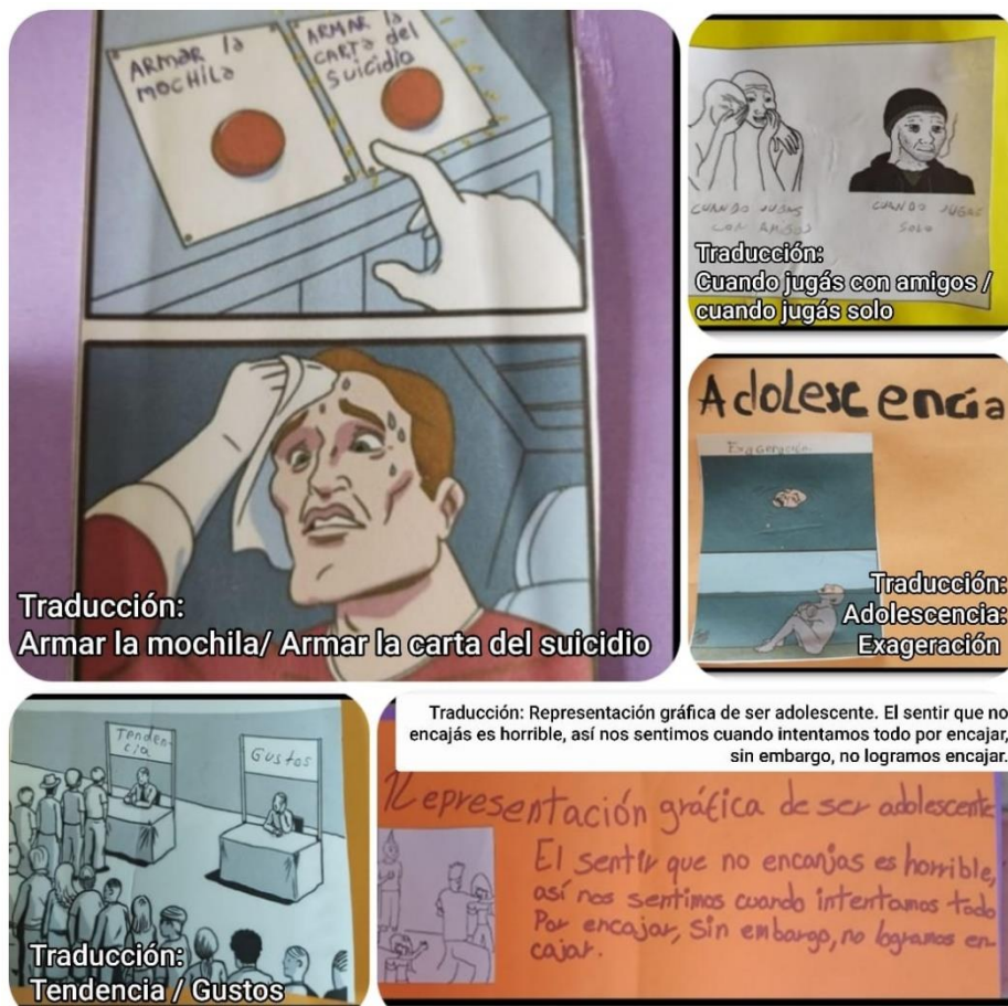
Ilustración 2. Recopilación de memes.

Por último, el espacio intercambio y puesta en común también permitió poner en discusión sensaciones más profundas y temas que afectaron al grupo anteriormente. En este sentido, la cuestión de la depresión y el suicidio fue abordada como un tema que pudo ponerse en palabras a través del humor, dando paso a posteriores intervenciones acerca del cuidado de la salud mental y sobre la necesidad de acudir a las redes de apoyo construidas.