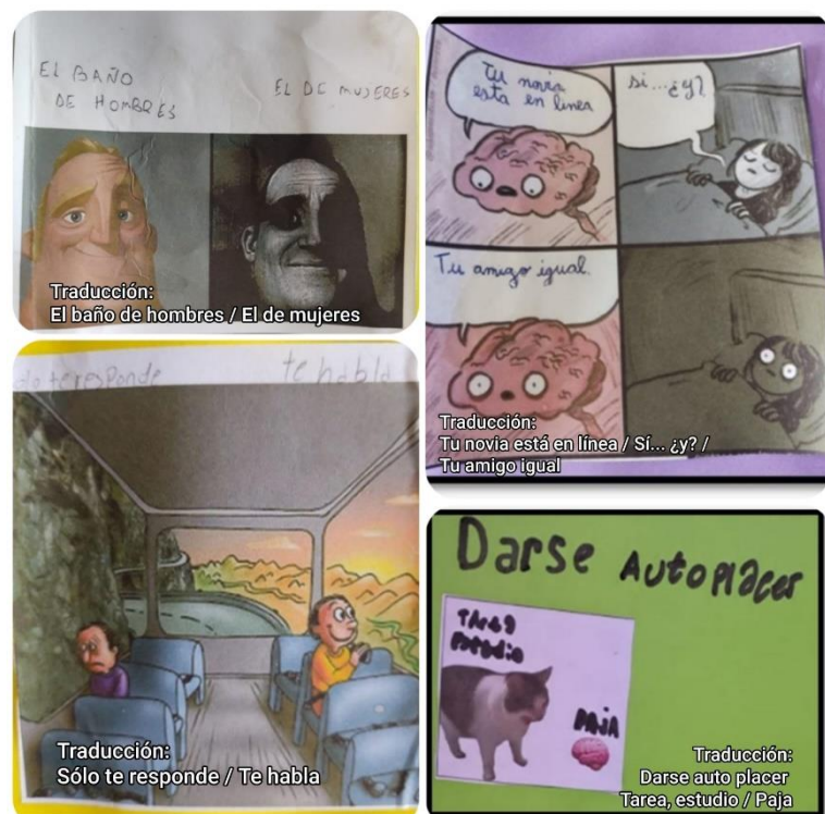
Ilustración 4. Recopilación de memes.

Por otro lado, aparecen las inquietudes sobre los vínculos sexoafectivos en un sentido más amplio. Las relaciones de pareja y de noviazgo se expresan como fuentes de interés, así como también de inseguridad. Conforme a ello, los mandatos sobre la monogamia y los sentimientos de celos son expresados con humor, pero también con seriedad. Surgen como preocupaciones manifiestas frases como “ Que tu novia esté en línea (...) puede que esté hablando con otros ” (Grupo 3). Al respecto, los grupos se permiten discutir sobre la calidad de los vínculos, atravesamientos de género en las relaciones y la importancia de pensar en vínculos sanos y no sanos.