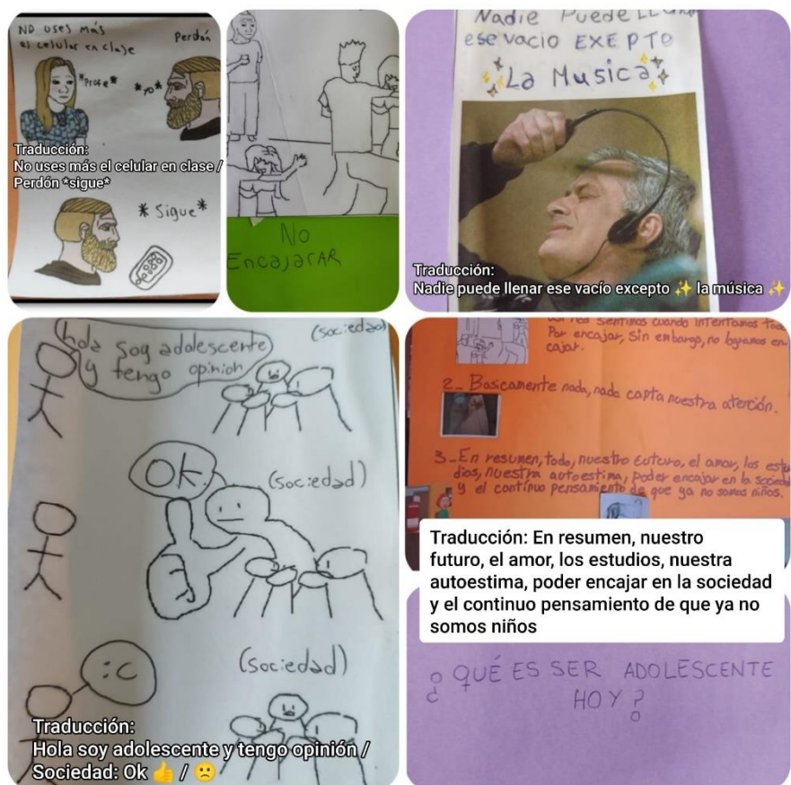
Ilustración 3. Recopilación de memes.

puede hablar con su mamá y papá sobre la mayoría de los temas, pero reconoce que no en todas las familias eso sucede. De esta forma, aquellos que refieren no contar con esos vínculos, destacan la importancia de la música, del juego, de las amistades, de hermanos o primos y de algunos docentes como lugares seguros y de contención para expresar aquello que necesitan en sus vidas cotidianas.