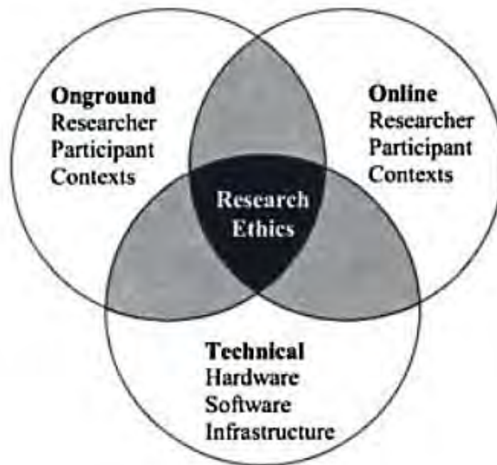
Imagen 1. Esferas de la investigación en contextos mediados por internet.

Hasta donde llega nuestro conocimiento, el escenario c no ha sido abordado por la bibliografía pues queda fuera del ámbito de las CMC ( Computer Mediated Communications )