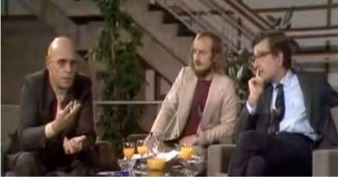
Imagen 1. Captura de pantalla del programa On Human Nature .

https://www.youtube.com/watch?v=n_AScyqFUCc .