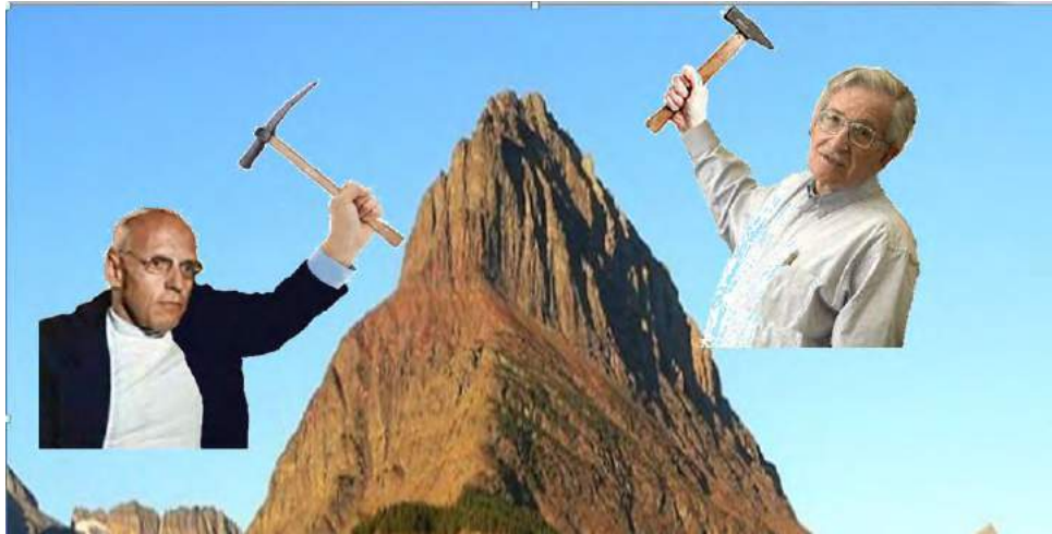
Imagen 3. Mineros del conocimiento.

Aquí tenemos a estos mineros del conocimiento: por una vía, Chomsky nos dio las bases para realizar la mayor abstracción sobre la lengua humana. Por otra vía, Foucault avanzó recopilando documentación con su Grupo de Información en las Prisiones y de allí nos regaló el broche terrible del siglo XX, Vigilar y Castigar :