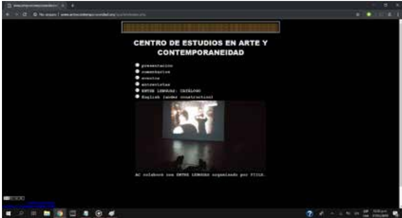
Figura 1. Página de inicio en español del sitio del Centro de Estudios en Arte y Contemporaneidad.

Sin embargo, al hablar de archivo no hacemos referencia únicamente a la posibilidad de construir un acervo de materiales académicos de consulta abierta y gratuita, sino, siguiendo a Foucault (1977), al sistema de las condiciones históricas que hace posible esos enunciados: