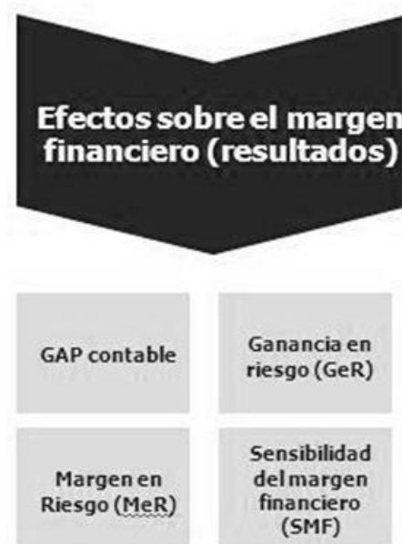
Figura 1 Técnicas de medición del riesgo de interés estructural para el margen financiero

existen diversas técnicas que permiten un mejor control del margen financiero, y del riesgo de interés al que está sometido. Sin importar la medición, se busca responder a la siguiente pregunta: ¿Cómo se afecta el margen financiero (a través de los ingresos financieros y los gastos financieros) por un movimiento de las tasas de interés hacia arriba o hacia abajo?