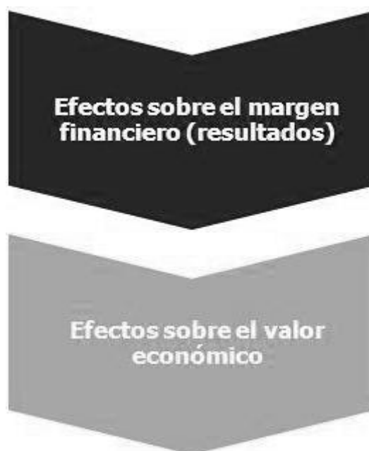
Tabla 1 Efectos del riesgo de interés estructural

es una visión más restringida a corto plazo. En este sentido, el análisis de la sensibilidad del valor económico es fundamental, debido a que el impacto de las fluctuaciones de los tipos de interés sobre el margen financiero puede que no refleje de forma precisa el efecto sobre el conjunto de las posiciones del banco.