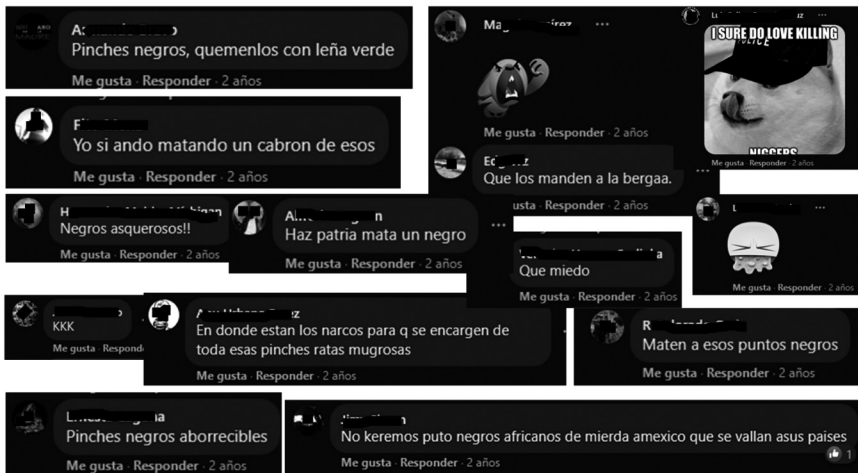
Figura 5. Tipo 5. Incitación explícita a la violencia

Capturas de pantalla desde la cuenta personal del Facebook de la autora, 2021. La imagen muestra una selección de algunos comentarios realizados en 2019, los cuales forman parte del corpus de 140 entradas analizadas en este trabajo (se cubrieron los nombres y las fotografías de las personas usuarias para proteger sus datos personales).