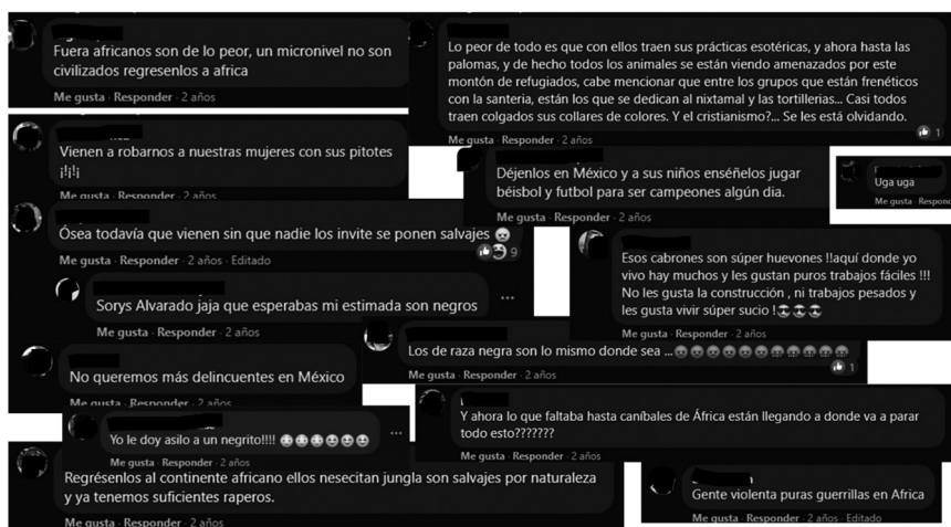
Figura 1. Tipo 1. Estereotipos varios

Capturas de pantalla desde la cuenta personal del Facebook de la autora, 2021. La imagen muestra una selección de algunos comentarios realizados en 2019, los cuales forman parte del corpus de 140 entradas analizadas en este trabajo (se cubrieron los nombres y las fotografías de las personas usuarias para proteger sus datos personales).