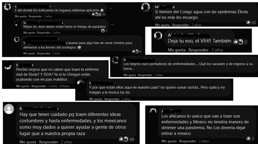
Figura 2. Tipo 2. Vectores de enfermedades

Capturas de pantalla desde la cuenta personal del Facebook de la autora, 2021. La imagen muestra una selección de algunos comentarios realizados en 2019, los cuales forman parte del corpus de 140 entradas analizadas en este trabajo (se cubrieron los nombres y las fotografías de las personas usuarias para proteger sus datos personales).