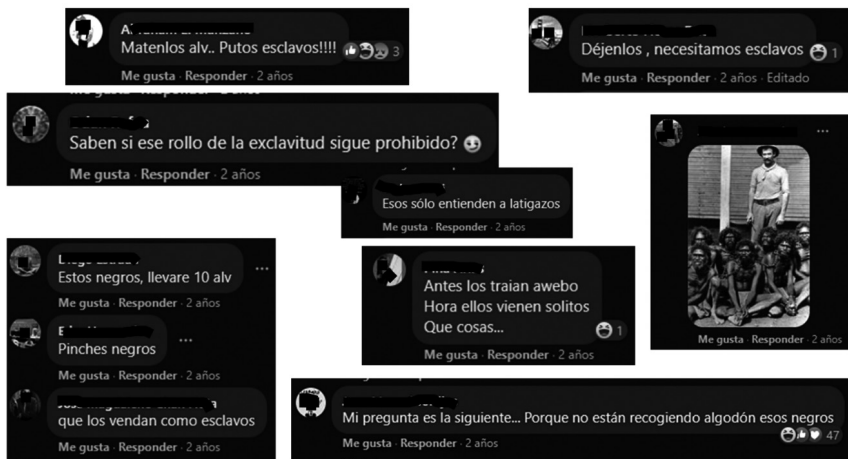
Figura 3. Tipo 3. Reducción a la esclavitud

Capturas de pantalla desde la cuenta personal del Facebook de la autora, 2021. La imagen muestra una selección de algunos comentarios realizados en 2019, los cuales forman parte del corpus de 140 entradas analizadas en este trabajo (se cubrieron los nombres y las fotografías de las personas usuarias para proteger sus datos personales).