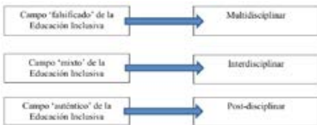
Figura 1. Síntesis de campos identificados en el desarrollo intelectual de la Educación Inclusiva.

El esquema que se presenta a continuación, se propone identificar la base epistemológica de cada uno de los tres campos identificados en el desarrollo intelectual de la Educación Inclusiva, los cuales, pueden sintetizarse de la siguiente manera: