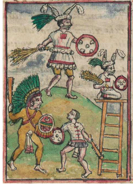
Figura 2. Representación del templo de la diosa Toci según la obra de Diego Durán. Fuente: Historia de las Indias de Nueva España e islas de la tierra firme , f. 286 (detalle). Imagen procedente de los fondos de la Biblioteca Nacional de España

de Sahagún se refiere que en ella se utilizaban a manera de armas, bolsas rellenas de pencas de nopal, por lo que sus características debieron de ser blandas . No obstante, sin querer desestimar dicha propuesta, es necesario considerar que las pencas de nopal no son, a mi parecer, un material que pudiera definirse blando del todo y, por lo que he podido comprobar, tras el análisis del término, éste en realidad se resiste a la traducción, lo cual no resulta extraño en los nombres propios de algunos rituales ya que, en varios de éstos, los nahuas no respetaron las reglas propias de la lengua, quizás debido a que se trataba de términos arcaicos o inclusive fueran préstamos de otros idiomas (véase Díaz Barriga 2021, 70-71).