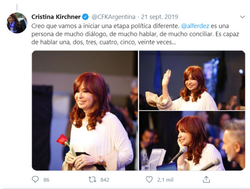
Imagen 4. Ejemplo componente político-electoral

que hizo alusión se encontraba su candidato a presidente, Alberto Fernández. Uno de los mayores capitales políticos sobre los que se hizo hincapié fue la participación de Fernández como jefe de gabinete del gobierno de Néstor Kirchner en 2003 (particularmente en referencia a la reestructuración de la deuda externa y el proceso de reconstrucción económico posterior). Además, en varias ocasiones se destacó su capacidad de diálogo y formación de consensos, indispensable para el nuevo espacio político y la etapa que se avecinaba.