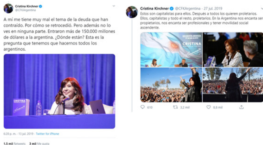
Imagen 5. Ejemplo de diagnóstico económico-social.