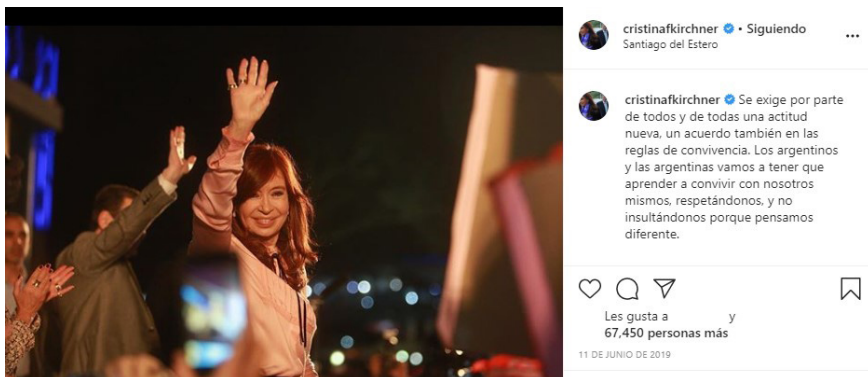
Imagen 7. Ejemplo de contrato social de ciudadanía responsable