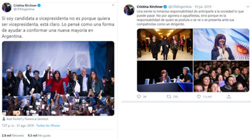
Imagen 1. Ejemplo de componente personal-político