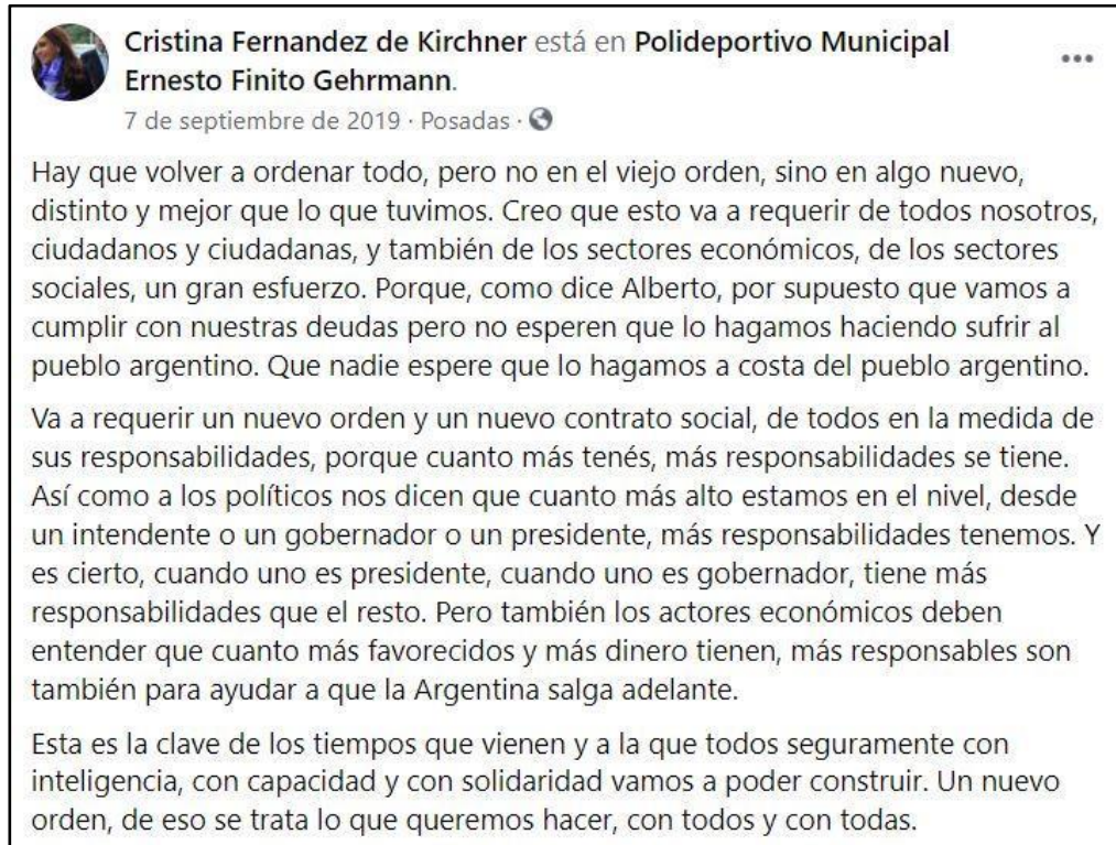
Imagen 4. Ejemplo de contrato social de ciudadanía responsable