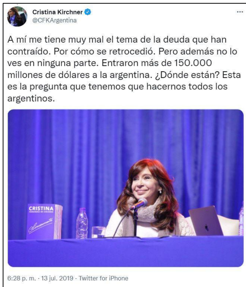
Imagen 3. Ejemplo de diagnóstico económico-social