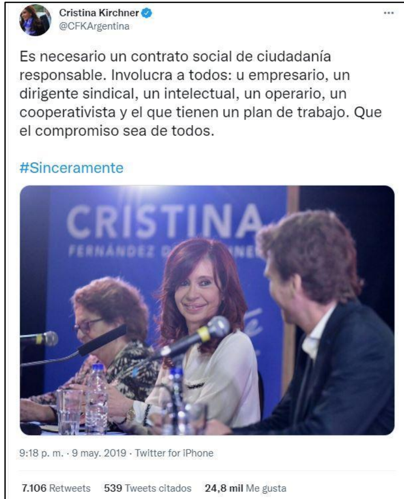
Fuente: Facebook de CFK, 9 de mayo de 2019