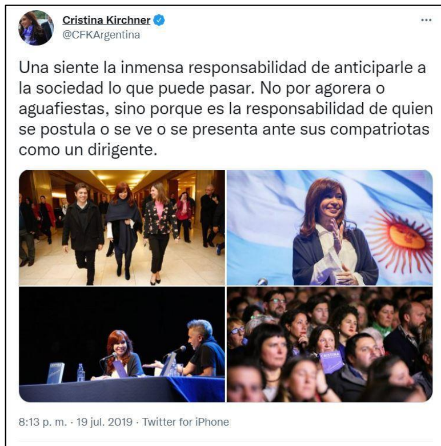
Imagen 1. Ejemplo de componente personal - político