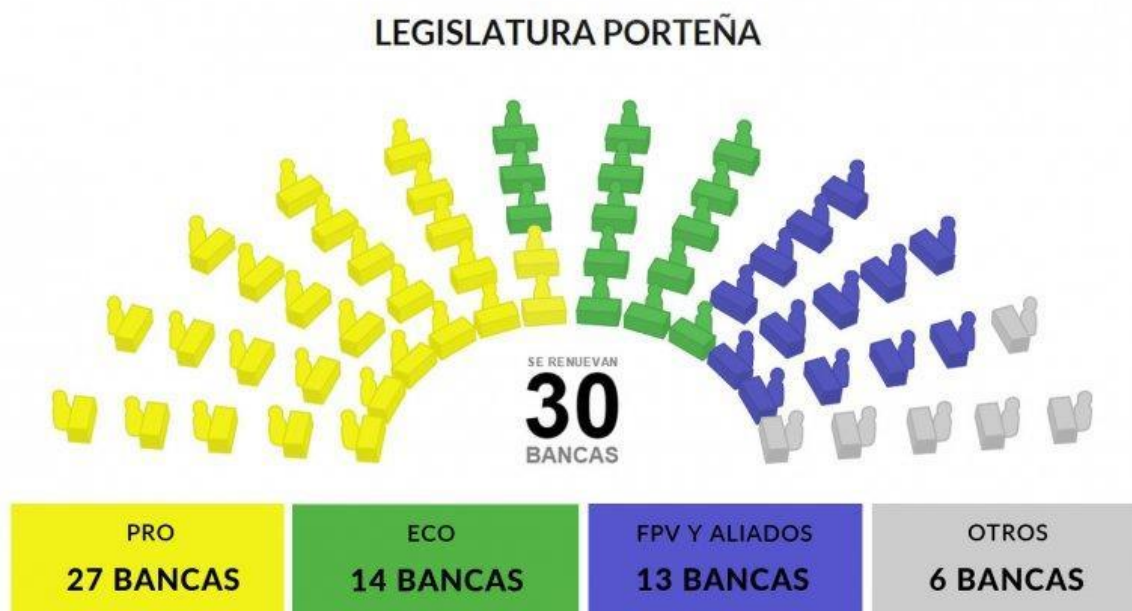
Gráfico 1: Distribución de la legislatura porteña a partir de diciembre 2015

A partir del 10 de diciembre, la Legislatura quedó distribuida de la siguiente manera: el PRO posee 27 bancas, ECO 14, el FPV 13, el FIT 3 y otros 6.