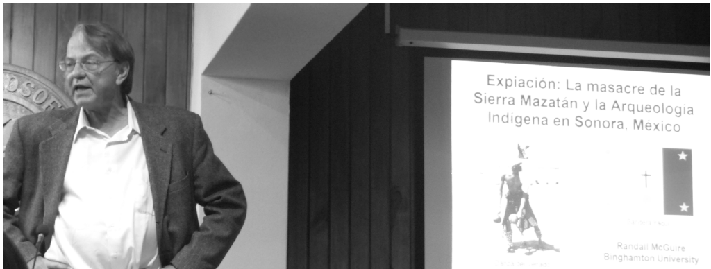
El Dr. Randall McGuire brindando su conferencia en el VI CNAHA (2015), Mendoza, Argentina.

formados en las Américas. Con el fin de las guerras contra España hacia los años 1820' también formaron una tontería, la misma tontería existe en los Estados Unidos: la idea que los criollos de Buenos Aires formaron una nación con sus esclavos y los indígenas, como un pueblo unido, contra los criollos en Colombia; eso es pura tontería. El problema más básico en todos los estados de las Américas es que estas tierras no fueron las tierras de la gente que formó las naciones, fueron tierras de la gente indígena. Entonces, ¿cómo puedes resolver esta contradicción? Hay varias maneras, en los Estados Unidos decimos "ellos fueron los primeros americanos, todos nosotros somos inmigrantes, ellos fueron los primeros". Esa fue la solución de los Estados Unidos. Aquí en Argentina la solución es muy fácil: "¿Indios? Los indios están en Perú, en Bolivia, ino hay indios aquí". Y en México es algo más complicado, es el concepto de indigenismo, el concepto que el mestizo es el mexicano, es una mezcla de europeo e indígena. Y el problema ahora, y siempre, es que a los indígenas nunca les gustó, y ellos están haciendo más y más cosas para recuperar su propio patrimonio y también para ganar dinero por eso, de los monumentos y cosas como esa. Y hubo luchas similares en Chile, cuando los atacameños ocuparon el museo en San Pedro de Atacama -eso creo que fue hace 10 años o más-. Esa es una lucha que está creciendo en América Latina y que hemos tenido por muchos años en Estados Unidos.