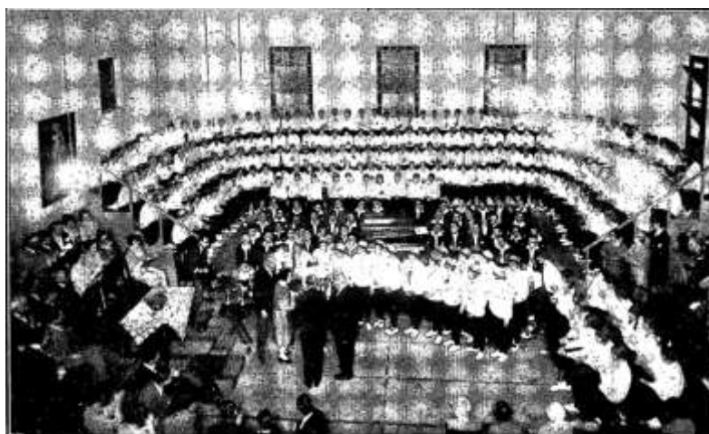
Entrega de la Copa Estímulo, de Niños, al equipo de Tercer Año.