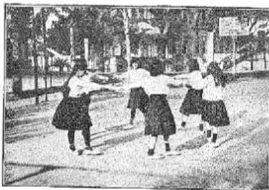
284. — Marchar al círculo