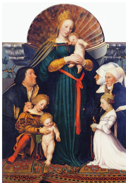
Imagen 1. Madonna de Darmstadt-Hans Holbein 1526.