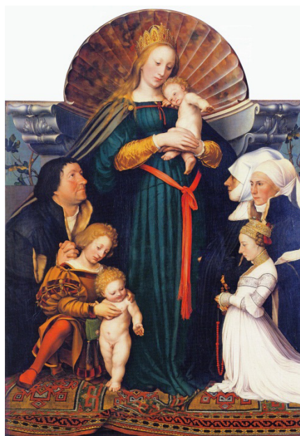
Imagen 1. Madonna de Darmstadt-Hans Holbein 1526.