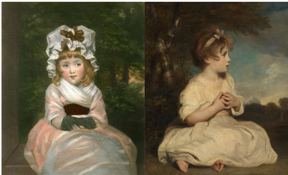
Imagen 2. Joshua Reynolds- La edad de la inocencia 1788.

juicio hay imágenes que son la síntesis del candor infantil, o en otras palabras, la puesta en escena de la idea de la inocencia inherente al cristianismo anterior a San Agustín o a la perspectiva rousseauniana. Puede que, el pintor inglés Joshua Reynolds haya sido quien diera pie al marco visual de la representación romántica de la infancia que rige hasta nuestros días, a saber, a la personificación o escenificación concreta, en carne y hueso, de esta noción en el momento en que pintó los cuadros El niño Samuel en 1776, La edad de la inocencia en 1788 (imagen 2) y Penélope Boothby (imagen 3) ese mismo año. Desde luego, Reynolds no inventó este entendido, explícito desde antes en lo pictórico como lo da a conocer el cuadro Allegoria della fortuna del italiano Lorenzo Leonbruno de 1523, en el que, dentro de un conjunto de personajes a un pequeño niño, impreciso y sin detalle, se le pone un diminuto título que indica que su cuerpo es la forma de la inocencia. Caso omiso, Reynolds va más allá, al disponer y vestir a la inocencia de un color, de una piel específica, de un género y de una edad.