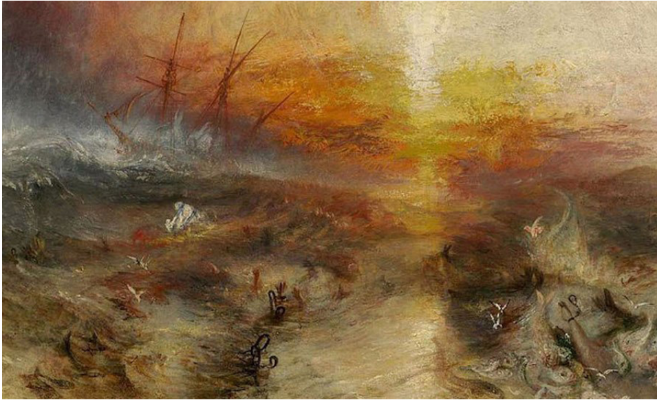
Imagen 7. William Turner- El barco de esclavos 1840.

a las imágenes a un contraste de ida y vuelta, como sobreviene con cualquier provisión informativa, para validarse, clarificar su semántica, revelar su tras escena, su historia y los caracteres culturales, políticos, estéticos, tecnológicos, mediales, económicos y sociales que la implican.