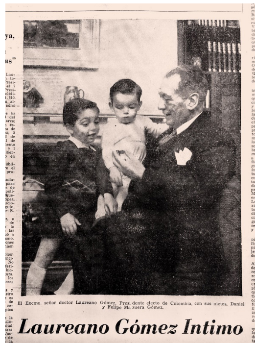
Imagen 5. “Cómo es en la intimidad el nuevo presidente de Colombia” en El Siglo . 6 de agosto de 1950.

En resumidas cuentas, que las imágenes hayan tenido contratiempos y aplazamientos recurrentes en el aparataje investigativo de la infancia tampoco implica subrayar una absoluta ausencia u opacar los avances que existen a lo largo de la historia. La concate-nación es de vieja data y para el campo de los estudios de la infancia esa unión olvidada promete un desarrollo metodológico y conceptual asaz fructífero, ya fuese haciendo de las imágenes de NNA su objeto de estudio o dándoles el estatus de fuentes para en-riquecer sus alcances en las pesquisas de cientos de temáticas. A pesar de esto, lo co-rriente o lo estándar en las directrices teóricas y metodológicas de la infancia decreta la postergación de las imágenes o su reducción a un indicador visual. ¿Por qué persiste esta proscripción? ¿A qué obedece dicho ostracismo? ¿Qué impide que la imagen tenga un mejor papel o un protagonismo en las indagaciones sobre la niñez? A continuación, varias conjeturas.