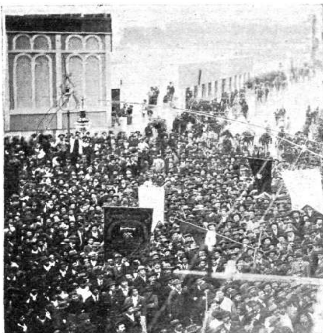
LA MANIFESTACIÓN OBRERA DIRIGIÉNDOSE A LA REFINERÍA

Hablar de la Federación Obrera Local Rosarina (FOLR) supone hacerlo de una institución anarquista de amplio espectro, pero hablar de anarquismo no supone, empero, hablar de la FOLR estrictamente. Situación similar ocurre entre policías y la División de Investigaciones, puesto que no suponen el mismo actor. Esta salvedad merece ser indicada puesto que los vínculos conflictivos entre el mundo anarquista y la policía son previos al contexto que aquí analizaremos, que se circunscribe a dos actores singulares que se desprenden de aquellos pero que no son reductibles. De esta forma, el marco temporal queda definido fundamentalmente por la creación de la División de Investigaciones en 1905, hecho que introduce a este nuevo actor que comenzó a vincularse de forma singular con el mundo obrero, sobre todo con la FOLR y el anarquismo; y 1907, año en que se cierra la experiencia concreta de nuestro pesquisa y su vinculación con dicha institución policial.