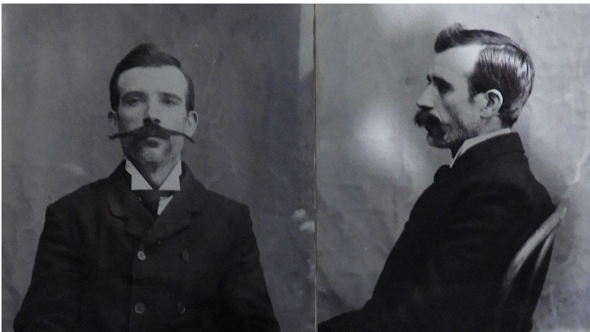
Fotografía proveniente de su prontuario N°343 17 de la sección Orden Social de la División de Investigaciones de la Policía de Rosario. Prontuarios Históricos, Archivo General de la Provincia de Santa Fe.