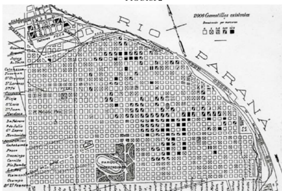
Mapa: Conventillos existentes en el área central de Rosario. Fuente: Tercer Censo Municipal de Rosario (1910)