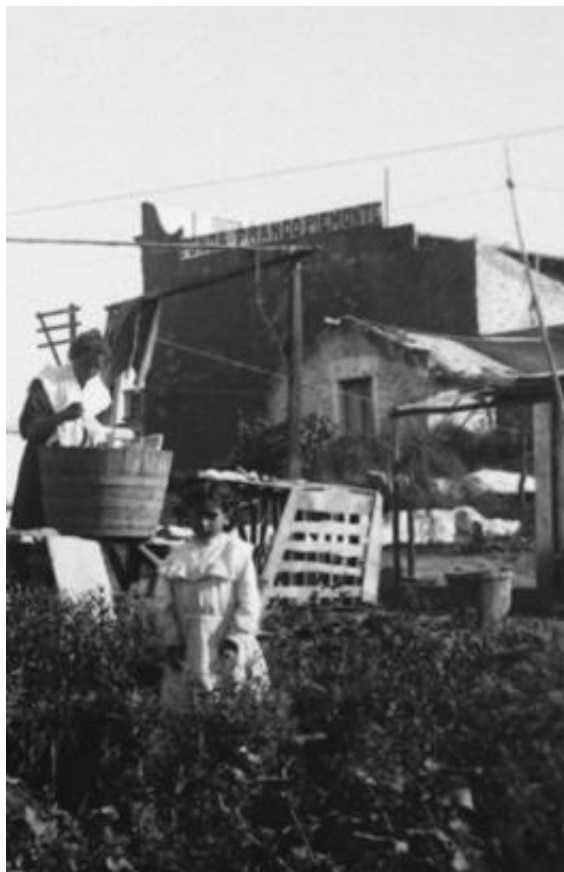
Mujer lavandera acompañada de su hija, quien probablemente también esté realizando labores siendo menor de 14 años. Fonda. Colección Soriano. C. 1905. Archivo de Fotografía de la Escuela Superior de Museología de Rosario.

Sin embargo, con excepción de la jurisprudencia, la representación internacional (Consulados) y la exigua participación en la administración pública, las mujeres participaron activamente de todos los rubros de la economía de la ciudad. Es menester señalar, como acertadamente advierte Juan Manuel Cerdá, que “...las categorías censales fueron el producto de un ‘clima de la época’” [Cerdá 2009:55]. Esto supone prestar atención a los posibles significados que categorías como “Quehaceres domésticos” podían tener para la época y para el censo. Como veremos, en el Censo Municipal de 1910 se haría explícita la interpretación de dichas labores como no asalariadas, es decir, interpretadas como extensiones “naturales” del hogar, por ende, no-