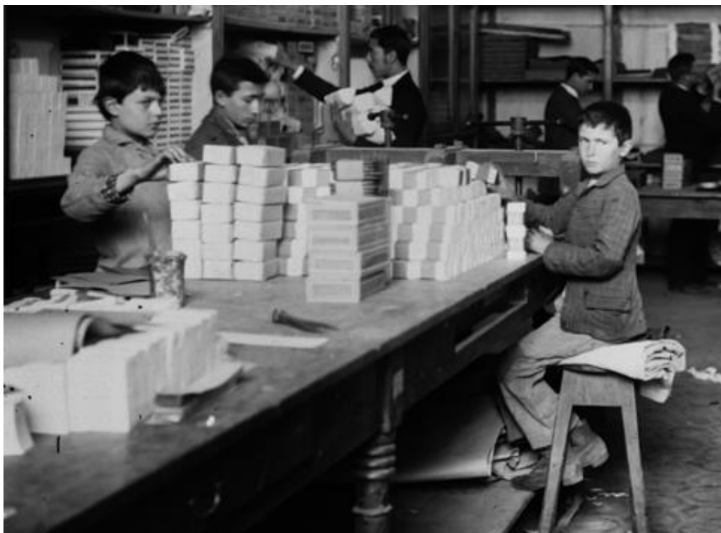
Niños trabajando en Testoni y Chiesa. Interior de cigarrería. Colección Pusso. Máquinas. Circa.1900. Archivo de la Escuela Superior de Museología de Rosario.

previamente quedaron subsumidos como indefinidos. Como sea, lo concreto es que el crecimiento de las mujeres con oficio aumentó tanto en términos relativos como absolutos. 7 Es claro que la presencia de mujeres en el mercado laboral se volvió significativa, de esto da cuenta el hecho de que, tomando a la totalidad de habitantes en edad laboral en 1900, el 66,2% declaró tener una profesión, representando en el caso de los hombres al 90,8%. Seis años después, serían el 81% los habitantes registrados en alguna profesión, representando los hombres un 91,3%. Es decir, el salto desde un 66,2% de la población con una profesión al 81% en seis años no se explica por el exiguo aumento