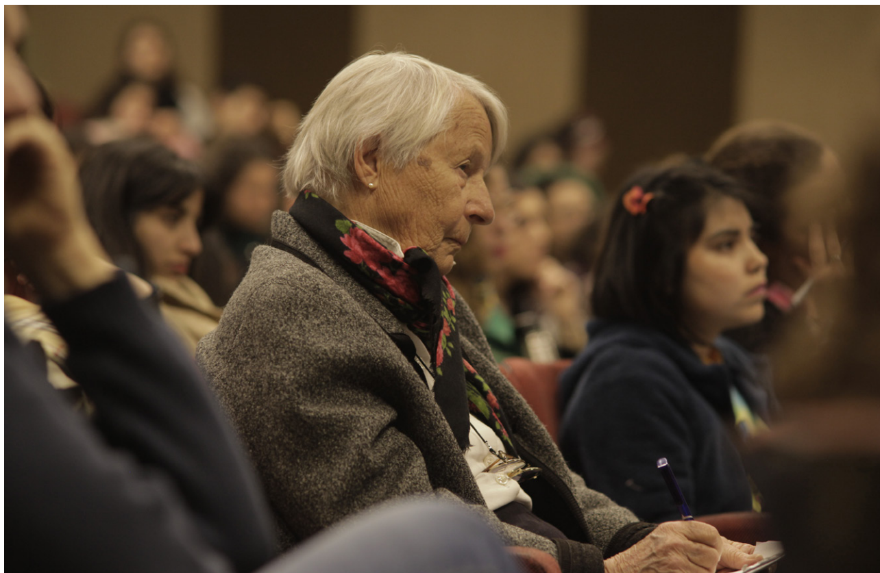
Verena en cada panel

reproductivos desencarnados como óvulos, espermatozoides, embriones, son cargados de significados y efectos socio-culturales. La raza, el sexo y la clase nuevamente se traman con la construcción de las desigualdades. En Verena Stolcke, la interseccionalidad es una pregunta que debe responderse empíricamente.