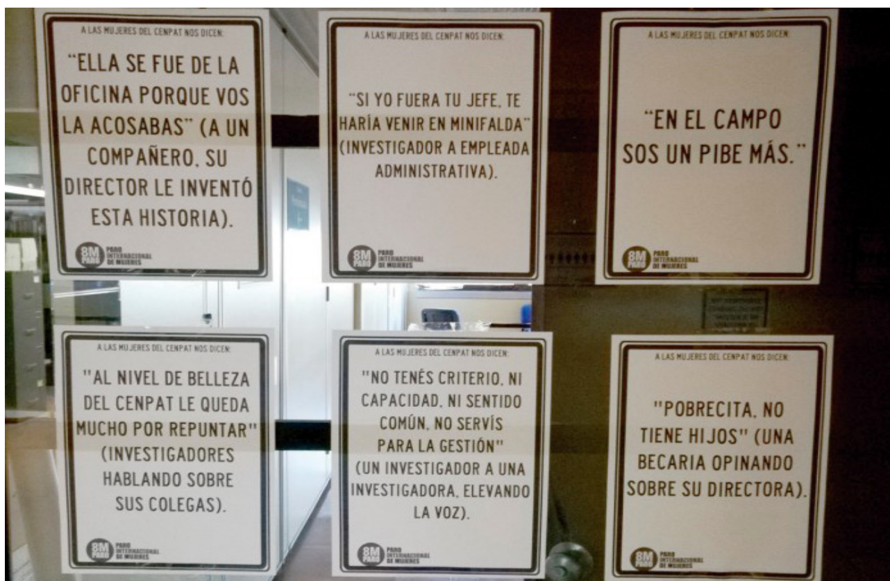
Fig. 1 - Carteles que fueron parte de la intervención del edificio CCT CONICET CENPAT, 8 de marzo del 2018.

“Lo que pasa es que te pones esas cosas tan cortas que, ¿qué quieres? yo me quedo al palo”.