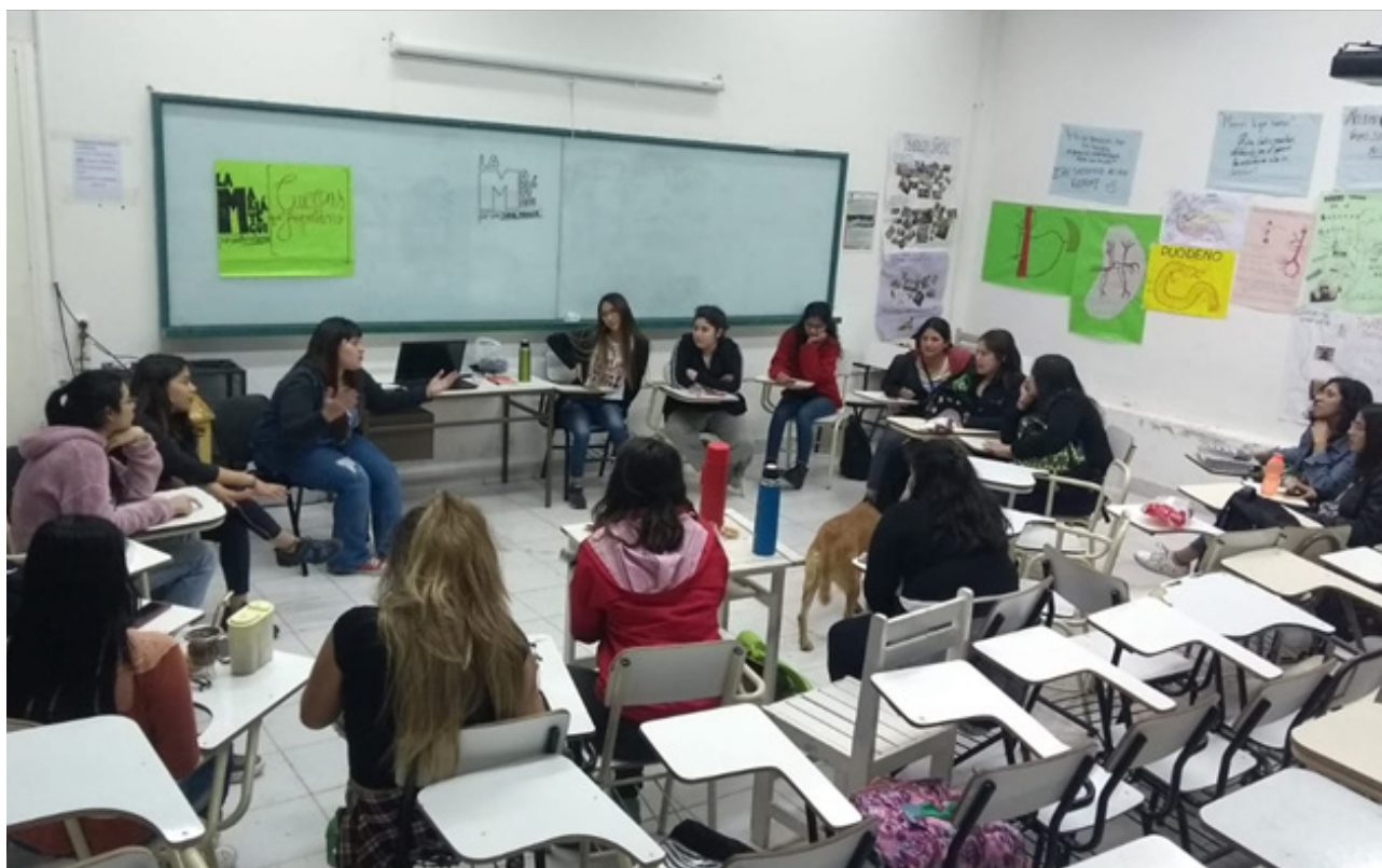
Femimateada, Unse. Agosto, 2019.

“La tarea sigue siendo, generar transformaciones”