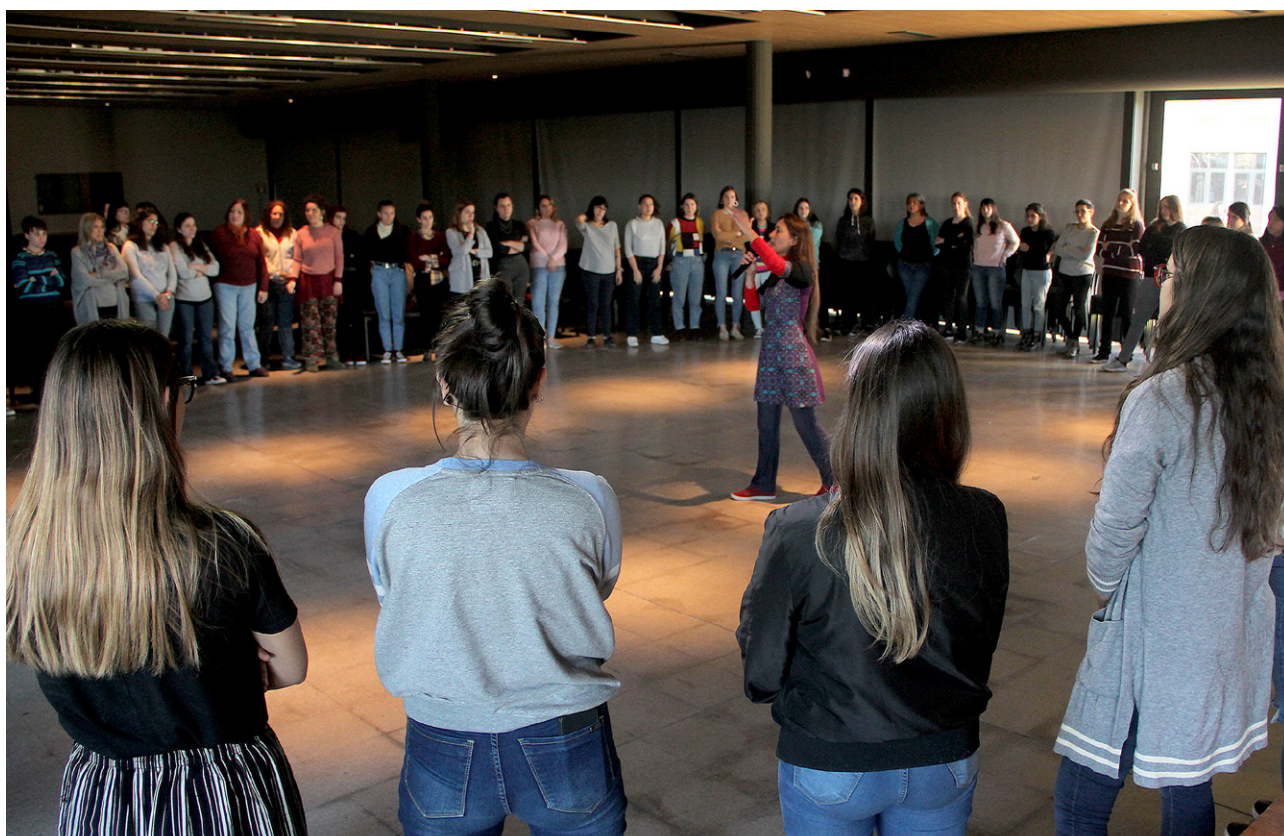
Ciclo de Formación de Promotoras contra la Violencia.