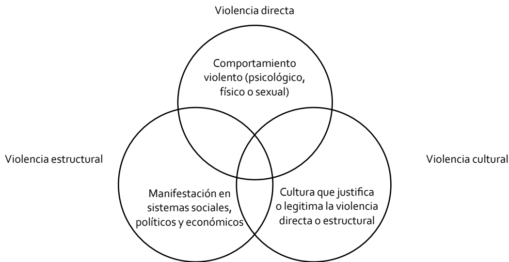
Figura 2. Modelo de Galtung.

Tal y como se ha abordado en capítulos anteriores (ver Capítulo 1), distintas costumbres y sucesos históricos podrían catalogar a la violencia como un fenómeno instintivo para el ser humano. Para explicar los orígenes de la violencia se han desarrollado