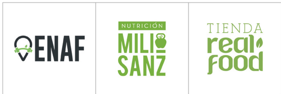
Figura 3. Sistema de identidad visual del centro ENAF.