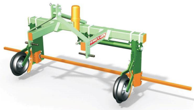
Figura 2. Desarraigadora de cebolla y ajo, marca Nievas.

Se trata de la empresa Nievas, fábrica de máquinas agrícolas, ubicada en Ruta 226 y La Rioja, Olavarría, provincia de Buenos Aires, una empresa familiar fundada en 1982 y con menos de 40 empleados; (Caso I, ver figura 2).