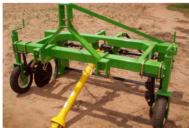
Figura 3. Arrancadora de cebollas AC160, marca Escañuela.

La segunda empresa es Implementos Agrícolas Escañuela Escagro SRL, ubicada en Av. Ciudad de Valparaíso km 9, Córdoba, una empresa también familiar con más de 40 años de trayectoria y menos de 40 empleados (Caso II, ver figura 3).