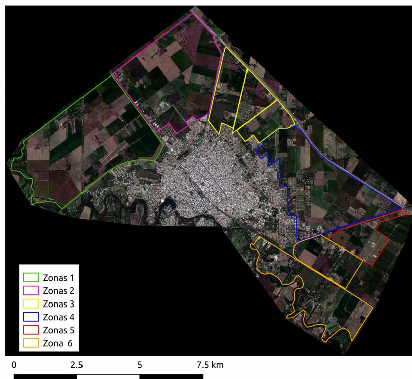
Figura 1. Periurbano de Villa María

Que Hicimos? Se estableció el área periurbana de la localidad de Villa María, Córdoba, Argentina en función de las Ordenanzas Municipales 6.401 y 6.402, del censo 2010 y de las parcelas rurales determinadas por la municipalidad dentro su jurisdicción. Dicho periurbano ha queda definido en 6 zonas (Figura 1) separado por las principales vías de acceso.