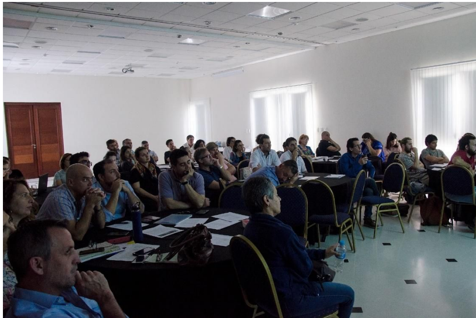
Figura 3. Tercer taller ciudad posible.

- Matriz de acciones : seguidamente se dispusieron en los mismos grupos matrices impresas para que los participantes completaran para los 3 ejes más importantes, las siguientes consignas: acciones concretas, actores involucrados en las mismas y plazos de ejecución respecto a los ejes ponderados . Esta actividad también fue cronometrada y puesta en común por cada grupo.