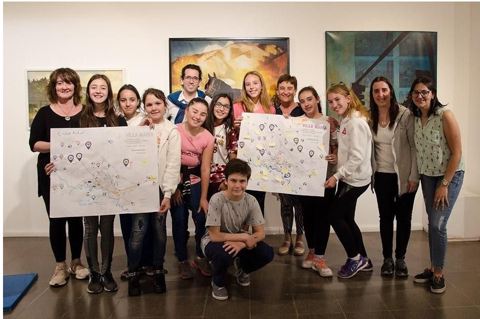
Figura 4. Talleres con los niños y niñas.

junto con la coordinadora del grupo. En ambos encuentros se aplicó la misma metodología donde primero se invitó a ubicar en el plano de la ciudad los distintos espacios, equipamientos y usos que identificaban en la ciudad actual, posteriormente se los incentivó a soñar con la ciudad deseada, expresándose a través de íconos y/o textos e incorporarlos en un nuevo plano (Figura 5).