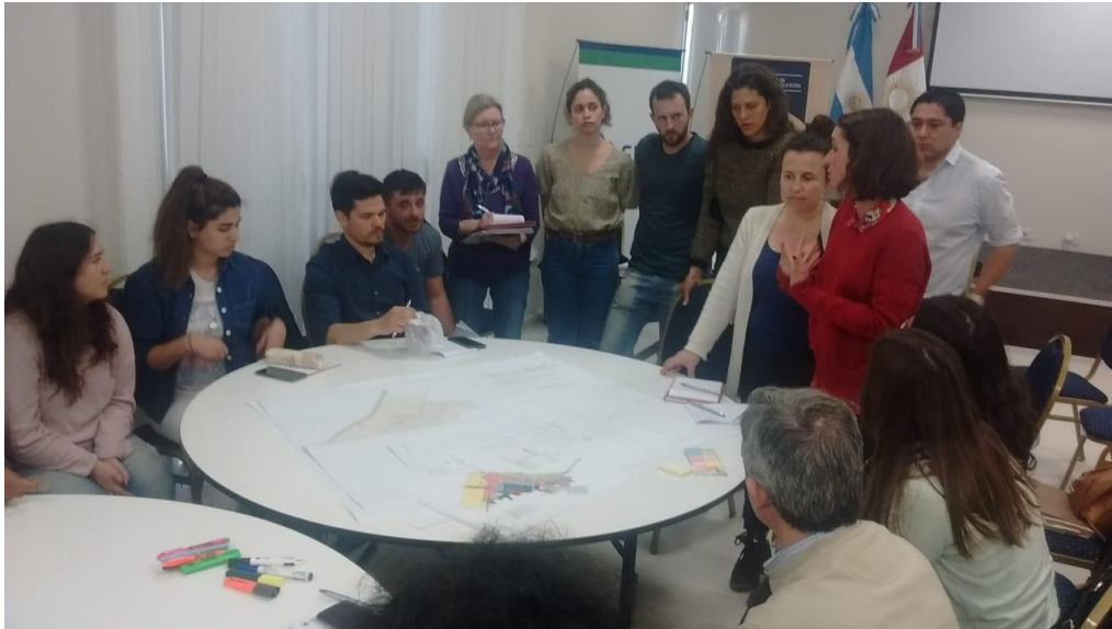
Figura 1. Primer taller ciudad actual. Mapeo colectivo.

teniendo como fin plasmar en mapas y notas las percepciones anteriormente discutidas. Se dividieron en 4 grupos de trabajo con tiempo cronometrado y un facilitador 2 ; finalizada la actividad cada grupo puso en común los resultados.