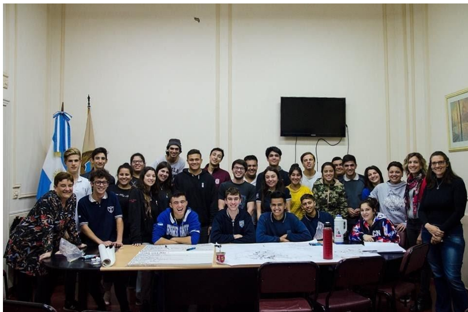
Figura 5. Talleres con los jóvenes.

Con la intención de seguir incorporando miradas, se creó un instrumento para recabar información acerca de cómo percibían los vecinos a la ciudad actual y qué consideraciones