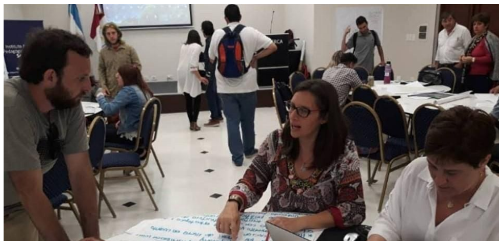
Figura 2. Segundo taller ciudad deseada. Mesa de Café.

- Pasados el tiempo establecido se continuaba con el siguiente eje y los resultados que los diferentes grupos plasmaron en afiches se retiraban y fueron sistematizados en un solo documento por eje por parte de los organizadores, mientras los participantes desarrollaban los ejes. El resultado parcial de la sistematización fue compartido al final de la jornada.