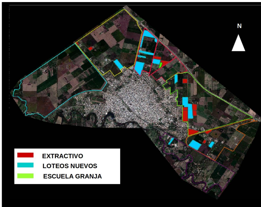
Figura N°5. Distribución del uso Extractivo (ladrilleras), Loteos Nuevos y Escuela granja.

Los resultados obtenidos hasta el momento permiten establecer que la transformación de los espacios rurales a urbanos, con un notable cambio en el uso del suelo, no fue tomada en