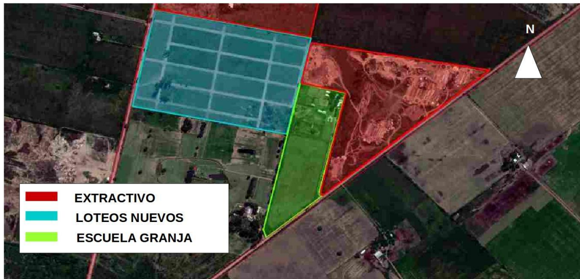
Figura N°6. Extractiva (exladrillera), escuela granja y loteo nuevo.

de 7 Ha, de las cuales, 4 Ha están destinadas a siembra, las restantes comprenden la estructura edilicia de la escuela, huerta y cría de animales. Este lugar es de importancia para la sociedad, pero por el tipo de actividades que desarrolla emana olores, lo cual será un tema de conflicto con los habitantes del loteo, llegando posiblemente a condicionar las labores de la escuela. Cabe destacar que gracias al loteo la escuela podrá conectarse al servicio de tendido eléctrico y cubrir totalmente esa necesidad para su funcionamiento (Figura N°6).