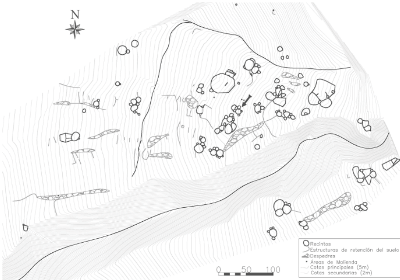
Figura 1. Sitio Arqueológico "La Bolsa 1". La flecha señala la ubicación de la unidad 14.

también en ámbitos aledaños (González y Núñez 1960; Berberían y Nielsen 1988a, 1988b; Cremonte 1996; Sampietro 2002; Scattolin et al. 2007; Aschero y Ribotta 2007; Oliszewski et al. 2008). Presenta un patrón radial, que surgía desde el centro del patio, al cual se adosaban varias habitaciones. Este gran recinto, de planta circular y de 10m de diámetro, era el que organizaba la circulación dentro de la vivienda. Poseía la única abertura hacia el exterior y dirigía el tránsito hacia las habitaciones restantes. Además estaba ocupado por algunos instrumentos y rasgos arquitectónicos notables. En su espacio medio se ubicaba una estructura subsuperficial de planta oval, Cista 1, donde se disponían los cuerpos de algunos de los difuntos de la unidad.