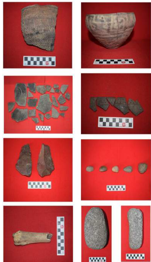
Figura 1. Materiales arqueológicos recuperados en CR1.

En los márgenes del cauce del río se realizaron una serie de prospecciones con el objetivo de identificar superficies