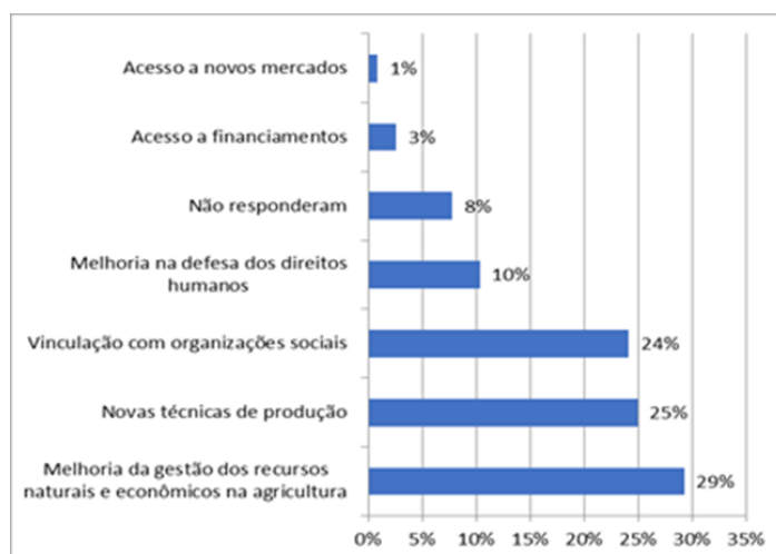
Figura 2 – Mudanças trazidas pelas capacitações realizadas nas Escolas Camponesas nos modos de produção e vida dos agricultores familiares.

Cerca de um terço dos agricultores entrevistados enxergam que as capacitações promovidas pelas ESCAMPs proporcionaram melhoria na gestão dos recursos naturais e econômicos em seus modos de produção. Outras duas mudanças foram levantadas por 25% e 24% dos entrevistados: a incorporação de novas formas de produzir e a organização social, respectivamente. As novas técnicas ensinadas buscam reduzir impactos ambientais das práticas produtivas e a organização social é alcançada pela articulação dos agricultores com as escolas e outras organizações na busca por melhores condições de vida por meio da luta política.