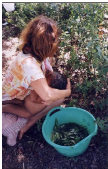
Figura 4: Kuña Karai curando a su nieto con plantas medicinales

padres es indispensable poseer algún conocimiento acerca de las enfermedades que “ agarran ” frecuentemente a los niños y de los recursos más eficaces para tratarlas. En general son las madres quienes perciben y detallan una amplia gama de síntomas y eventuales causas que conducen a un diagnóstico presuntivo o más firme. Y suelen ser los padres del niño quienes intervienen más activamente en la búsqueda del recurso terapéutico, en especial si éste se encuentra en sectores alejados de las viviendas o en el monte. La intervención de uno u otro en la búsqueda y administración de los remedios depende del tipo de enfermedad que padece el niño y de la trayectoria y experiencia previa del adulto, tanto en relación a sus conocimientos sobre las enfermedades, como en el manejo de los “ yuyos ” u otros tipos de recursos terapéuticos (SY, 2007).